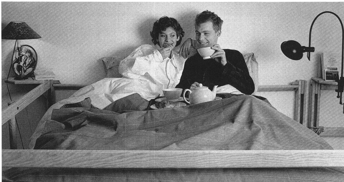
La folie des hauteurs...

les lits superposés, ce qui était déjà un progrès. La mezzanine «élimine» complètement le lit, et l'espace ainsi libéré est lui-même aménagé de manière agréable et fonctionnelle pour, véritablement, gagner de la place.