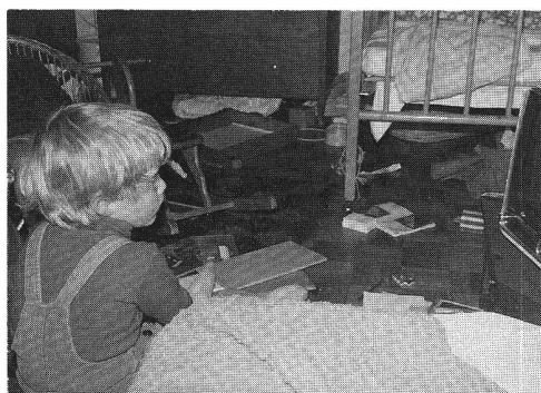
Chambre encombrée, enfants stressés.

Dénicher aujourd'hui un appartement de dimension satisfaisante à un prix raisonnable n'est pas chose facile. Cette pénurie affecte principalement les jeunes familles lors d'une nouvelle naissance ou lorsque frères et sœurs devenus grands ne peuvent plus partager la même chambre. Nécessité oblige, les fabricants commencent à produire des équipements adaptés. Le premier Salon du «Gagne-Place», à Paris, l'an dernier, a connu un grand succès. Cette «mode» gagne aussi la Suisse romande.