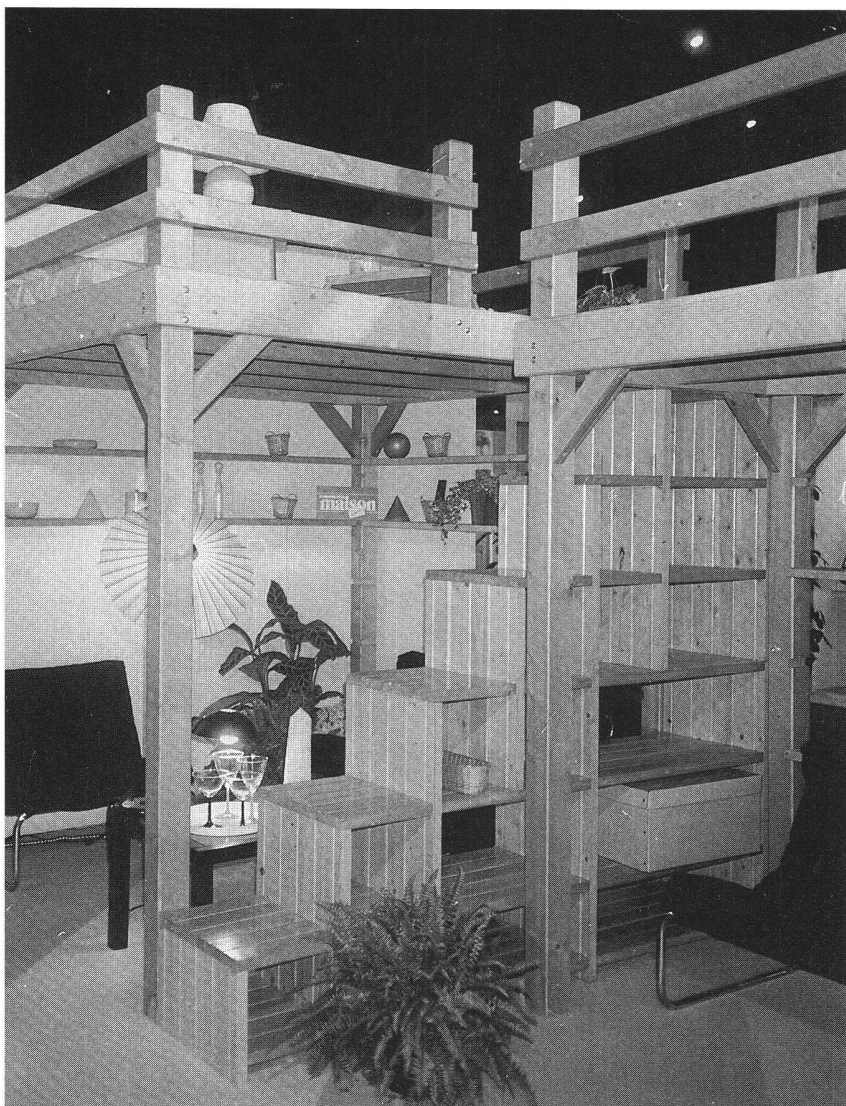
Le Salon du « Gagne-Place », à Paris (novembre 1986).

Toutes montrent que les petits, tout comme les adolescents, se sentent « écrasés » si leur chambre est encombrée de meubles trop volumineux. En règle générale, il faut éviter à tout prix l'armoire massive dévorant l'indispensable espace nécessaire aux jeux. Les rayonnages courant contre les murs sont bien préférables. Une table? Une