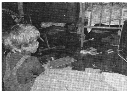
Chambre encombrée, enfants stressés.

Dénicher aujourd'hui un appartement de dimension satisfaisante à un prix raisonnable n'est pas chose facile. Cette pénurie affecte principalement les jeunes familles lors d'une nouvelle naissance ou lorsque frères et sœurs devenus grands ne peuvent plus partager la même chambre. Nécessité oblige, les fabricants commencent à produire des équipements adaptés. Le premier Salon du «Gagne-Place», à Paris, l'an dernier, a connu un grand succès. Cette «mode» gagne aussi la Suisse romande.