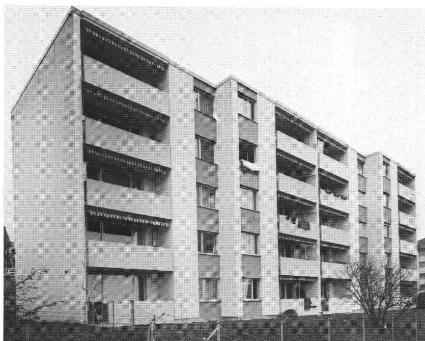
Rue des Noyers 37-39 Neuchâtel

Tous les experts ne sont pas d'accord en matière d'isolation thermique, mais à Neuchâtel on a résolument opté pour l'isolation périphérique. Un matériau composé de trois couches — aluminium profilé, matière isolante proprement dite et barrière de vapeur — est posé directement contre la façade des immeubles. Le bâtiment se trouve ainsi vêtu d'une sorte de « cosy ». Les premiers calculs montrent que ce système permet une économie de mazout de l'ordre de 30%.