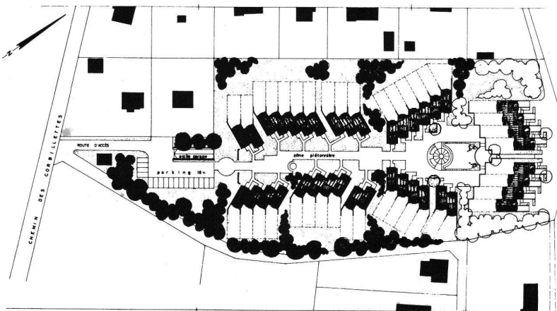
Projet des Corbillettes: 40 maisons familiales de 4, 5 et 6 pièces pour un total de 200 pièces; boxes individuels en sous-sol.

une aire d'accès et de stationnement commune entre les copropriétaires voisins ainsi qu'un cheminement piétons utilisable également par les futurs habitants des constructions projetées sur les parcelles jouxtant celle qui nous est proposée.