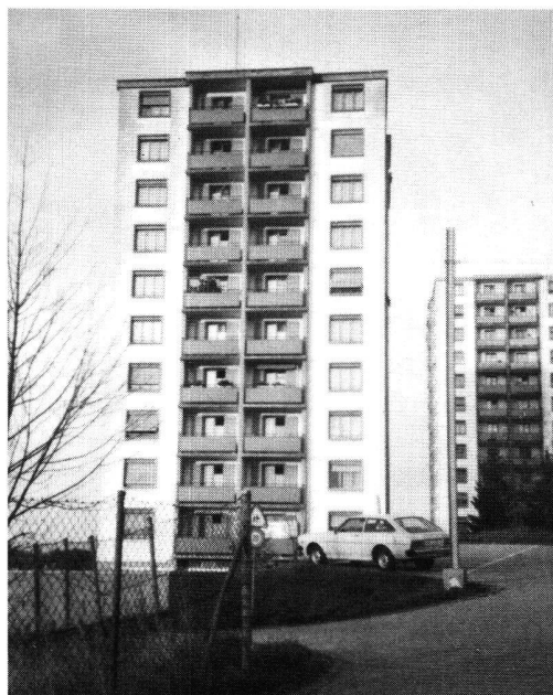
Cité des Mélézes.

— Prix des loyers sans concurrence, même s'il a fallu les majorer en raison de l'augmentation du taux hypothécaire. Disons que le loyer représente les 15% du revenu de l'occupant;