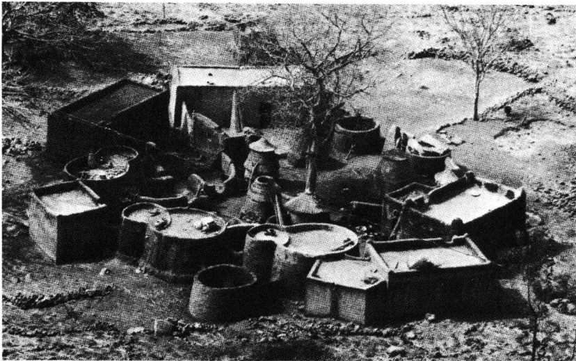
Sauvegarder les traditions: ici, beauté de l'architecture de terre d'une habitation rurale en Haute-Volta.

L'utilisation des ressources locales ou leur rejet soulève un problème idéologique qu'il faut élucider avant d'aller plus loin. Certains pensent que c'est par l'adoption de normes modernes que les populations rurales pourront un jour accéder au confort et aux commodités occidentales; ils s'imaginent qu'en se servant des matériaux traditionnels et de la technologie locale on interdit au futur habitant toute possibilité de mieux vivre. Il est évident qu'il faut apporter à ces populations des éléments indispensables — encadrement sanitaire, développement des pratiques hygiéniques, etc. — sans toutefois leur imposer des modèles étrangers souvent coûteux et inadaptés à leur attente. L'amélioration des techniques déjà utilisées constitue une aide efficace s'intégrant parfaitement à leur économie et leur mode de vie, et plus adéquates que l'importation de technologies élaborées. Ainsi, l'incorporation d'autres produits ou le dosage différent des matériaux traditionnels suscitent des mortiers ou des briques d'une qualité supérieure.