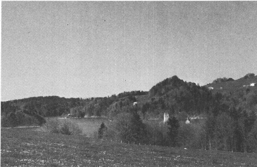
Le lac de la Gruyère et l'île d'Ogoz.