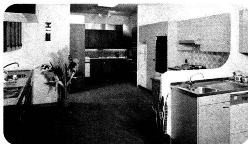
● votre cuisine

1211 Genève Grand-Pré 33-35, Tél. 022/34 80 50 1000 Lausanne Rue des Terreaux 21, Tél. 021/20 32 11 1800 Vevey Rue St-Antoine 7, Tél. 021/51 05 31 1860 Aigle Route d'Evian, Tél. 025/2 36 23 1837 Château-d'Oex Le Pré, Tél. 029/4 75 75 1400 Yverdon Rue des Utins 29, Tél. 024/25 81 91 1951 Sion Rue de la Dixence 33, Tél. 027/22 89 31 3930 Viège Lonzastrasse, Tél. 028/48 11 41