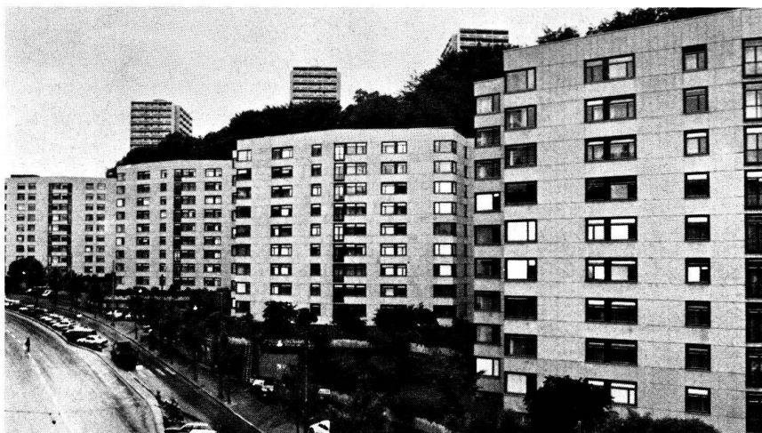
Borde, Nos 26-32

Des lettres de remerciement, à l'écriture parfois tremblée, témoignent de la reconnaissance des locataires, âgés, pour lesquels un billet de 20 fr. représente beaucoup.