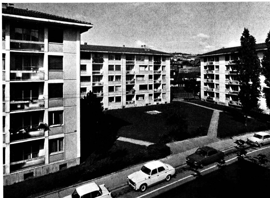
Montelly, Nos 34-44

La baisse de la natalité est préoccupante. Les enquêtes sociologiques montrent que bien souvent c'est l'exiguïté des appartements qui freine les couples dans leur désir d'avoir un second, et surtout un troisième enfant. La longueur des listes d'attente pour les 4 pié-