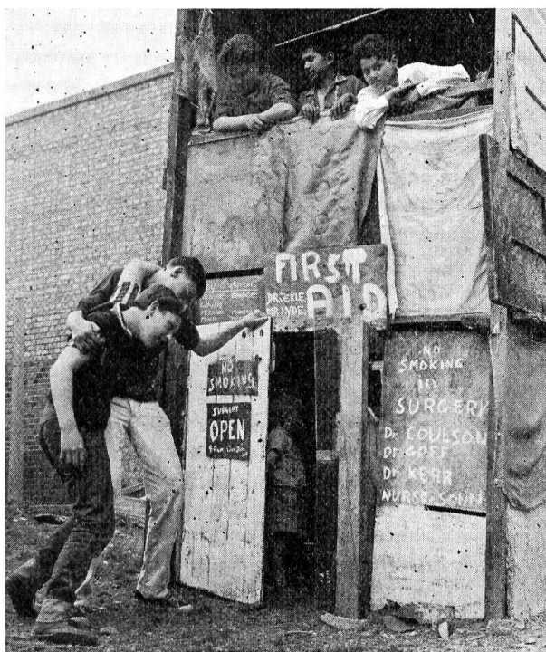
A Londres, place de jeux pour enfants.

Deux architectes anglais se sont spécialisés dans la mise sur pied de parcs pour petits handicapés. Le dernier en date est unique en son genre dans le monde car on a voulu lui imprimer dans la mesure du possible le caractère d'un terrain d'aventure. Il a été aménagé en 1970 dans