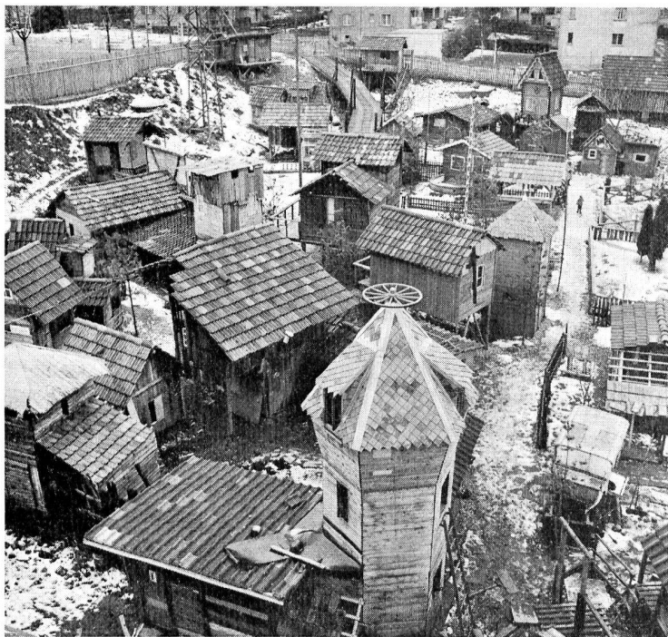
En Suisse, une place de jeux « Robinson », de Pro Juventute, à Heuried.

plafonds et les parois on entendrait une aiguille tomber si le silence existait. Il y a une génération seulement, les enfants pouvaient jouer, s'époumonner dehors dans les petites rues tranquilles, les venelles, les arrière-cours où il y avait des réduits, des bûchers, des murets, peut-être même des arbres pour jouer à cache-cache ou aux gendarmes et aux voleurs. Dans mon village, les coins et recoins, les escaliers de bois, les abris, les fontaines et les haies et même le ruisseau ont disparu sous le béton et l'asphalte. Mais où s'en est allé le bonheur d'antan ?