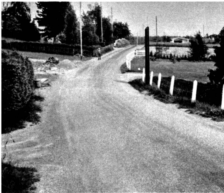
Le paysage routier avant les travaux.