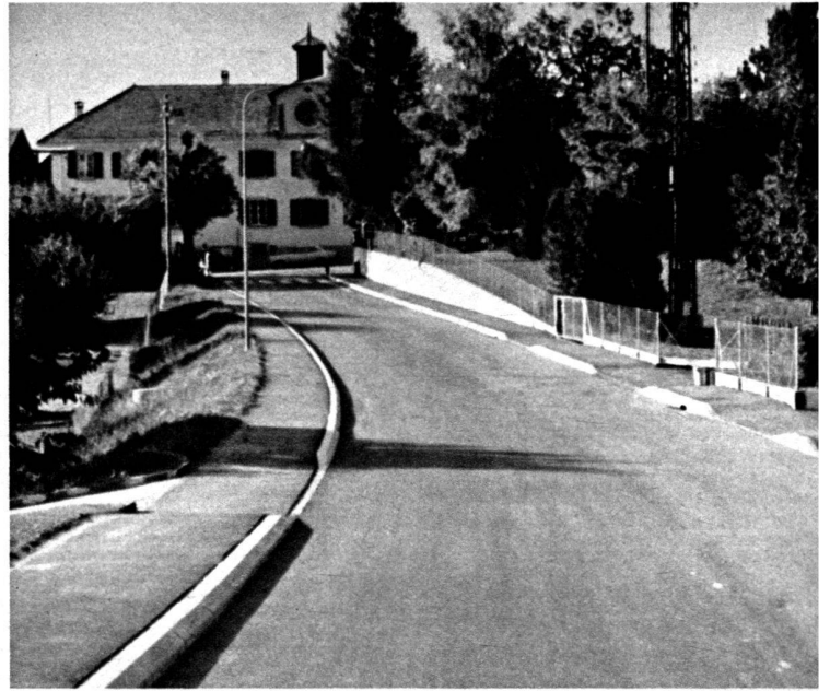
Le même paysage après les travaux.