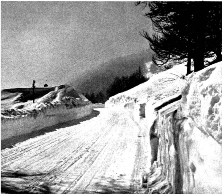
La route sous les affronts de l'hiver.