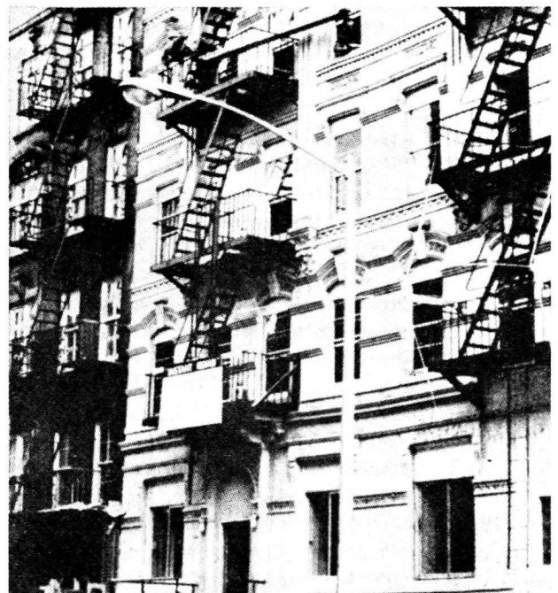
Bâtiment d'habitation du programme de restauration immédiate.

Avant même que l'analyse de la restauration et la collecte des informations qui s'y rapportent aient été achevées, deux séries de faits ont été établis sans conteste en réponse aux questions posées au début: