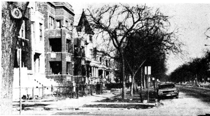
Une rue résidentielle dans la zone Douglas-Lawndale.