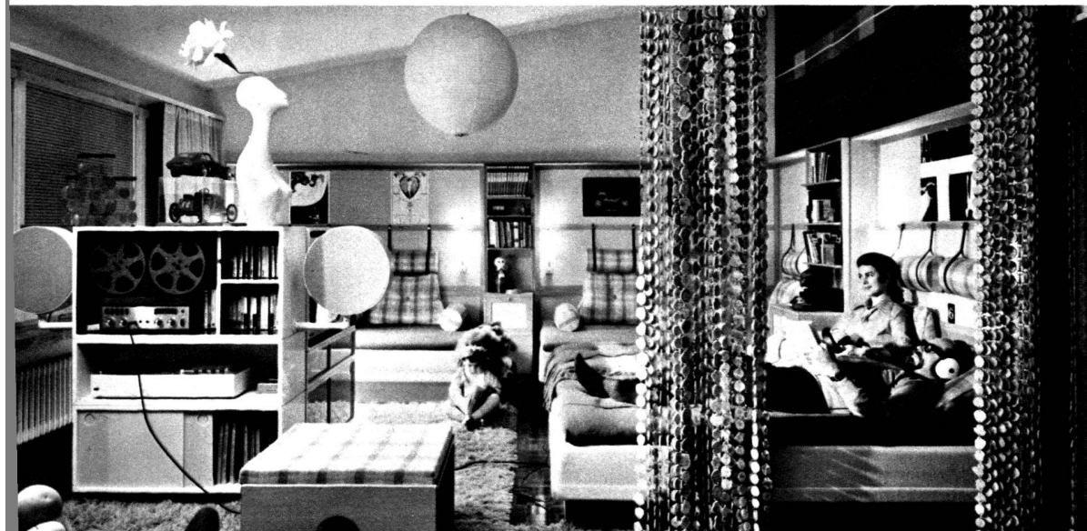
Ake Assbjer apôtre du «confort fonctionnel»