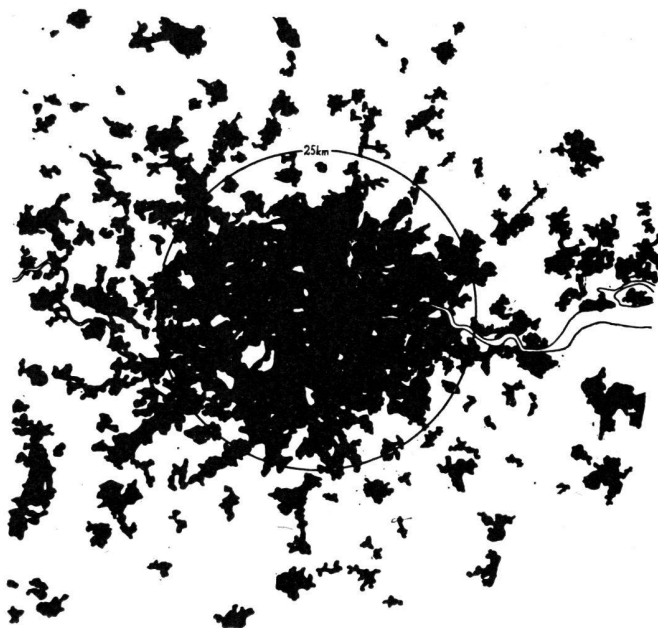
La même échelle: le Grand Londres.

Le nombre total des étudiants immatriculés dans les universités suisses durant le semestre d'hiver 1967-1968 se montait à 35 914, dont 8361 étrangers. Le nombre des étudiantes atteignait 7601. Voici les chiffres des divers établissements: