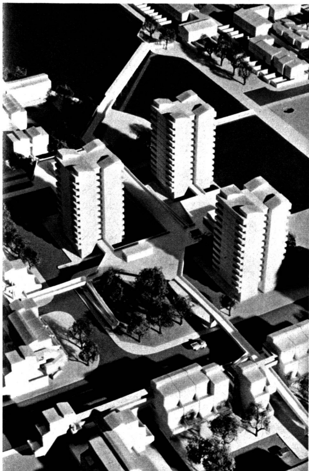
«Point Royal», un impressionnant immeuble de dix-sept étages et de cent deux appartements avec garages dans le sous-sol, à Bracknell, ville nouvelle du Berkshire, dans le sud de l'Angleterre