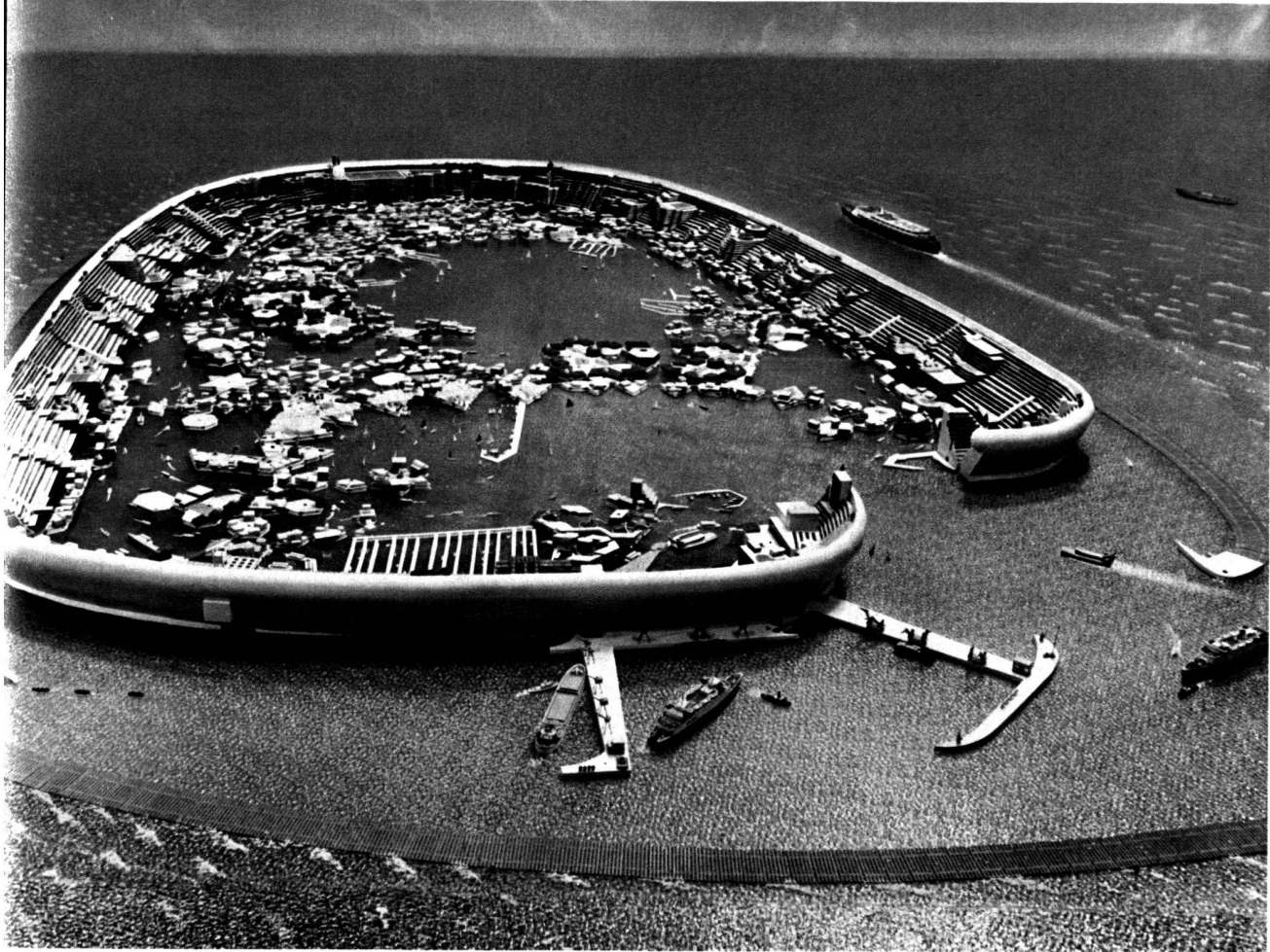
Une nouvelle ville, Milton Keynes, sera édifiée et aménagée dans cette partie du comté de Buckingham, dans le sud de l'Angleterre, entre Bletchley et Wolverton