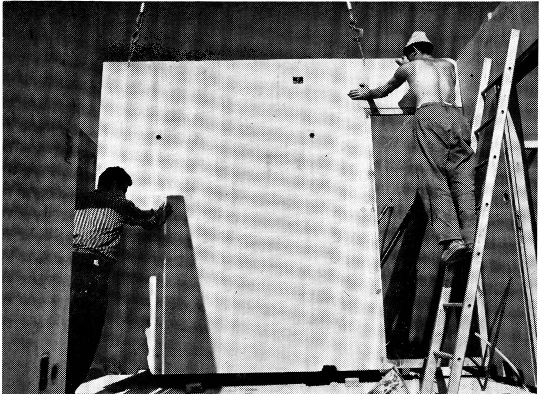
Eléments IGECO pour maisons familiales type ME