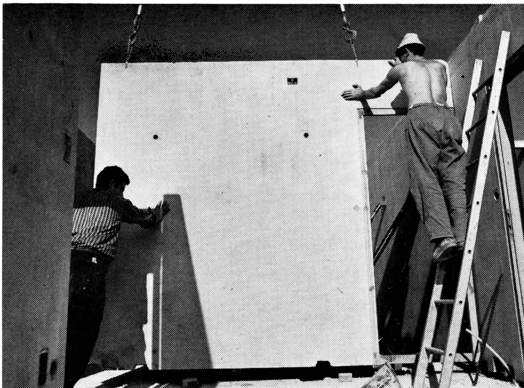
Eléments IGECO pour maisons familiales type ME