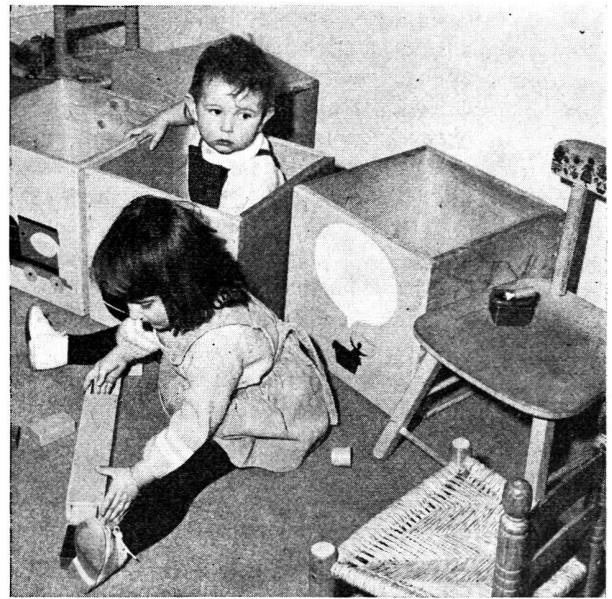
A la garderie de Mont-Goulin: Les tout petits s'instruisent en s'amusant.

Je suis allée voir cette garderie. Tout est neuf et avenant. Une pièce est destinée aux tout petits qui s'amuse assis sur un beau tapis, comme le préconise M me Montessori. L'autre chambre comprend, en bordure de deux parois, des chaises et des tables sur lesquelles les enfants plus grands peignent, dessinent et bricolent. La décoration est gaie, de bon goût, avec de belles photos d'enfants aux murs et une panoplie de jeux et jouets éducatifs Pinocchio , afin d'inciter les mères à les examiner et si possible les acquérir pour les donner à leurs enfants.