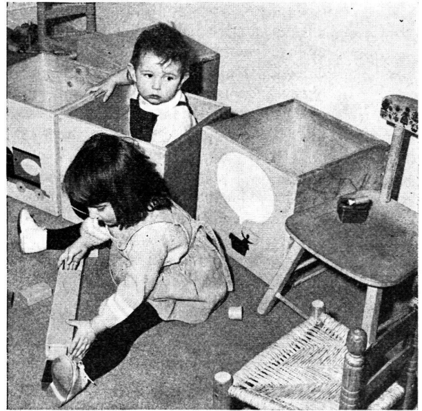
A la garderie de Mont-Goulin: Les tout petits s'instruisent en s'amusant.

Je suis allée voir cette garderie. Tout est neuf et avenant. Une pièce est destinée aux tout petits qui s'amusent assis sur un beau tapis, comme le préconise M me Montessori. L'autre chambre comprend, en bordure de deux parois, des chaises et des tables sur lesquelles les enfants plus grands peignent, dessinent et bricolent. La décoration est gaie, de bon goût, avec de belles photos d'enfants aux murs et une panoplie de jeux et jouets éducatifs Pinocchio , afin d'inciter les mères à les examiner et si possible les acquérir pour les donner à leurs enfants.