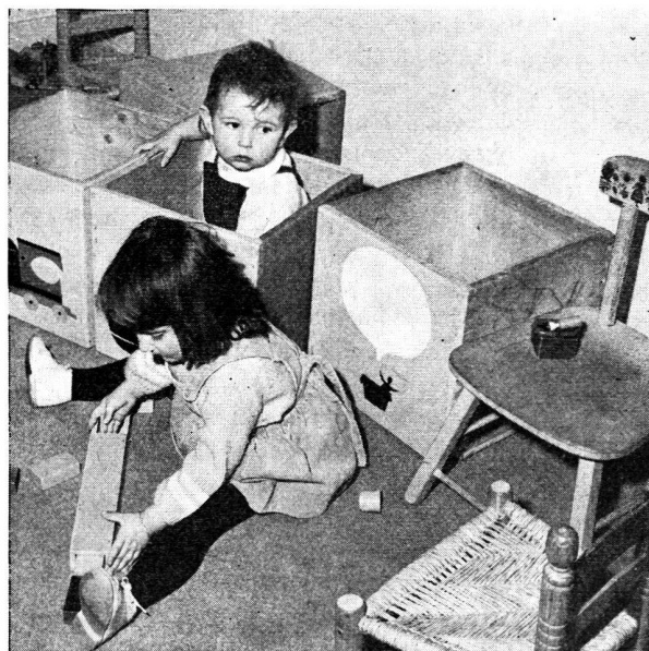
A la garderie de Mont-Goulin: Les tout petits s'instruisent en s'amusant.

Je suis allée voir cette garderie. Tout est neuf et avenant. Une pièce est destinée aux tout petits qui s'amusent assis sur un beau tapis, comme le préconise M me Montessori. L'autre chambre comprend, en bordure de deux parois, des chaises et des tables sur lesquelles les enfants plus grands peignent, dessinent et bricolent. La décoration est gaie, de bon goût, avec de belles photos d'enfants aux murs et une panoplie de jeux et jouets éducatifs Pinocchio , afin d'inciter les mères à les examiner et si possible les acquérir pour les donner à leurs enfants.