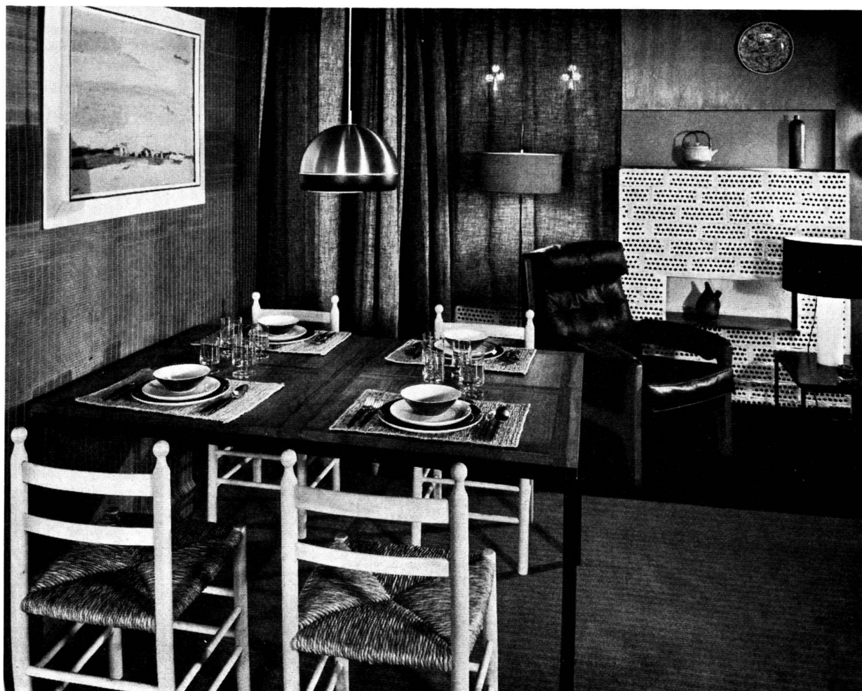
Table de Wieser. Chaises paillées portugaises. Décoration en briques de Maurice Blanc.

Mais on ignore en général un fait important. Il existe aujourd'hui des fauteuils, des chaises, des tables qui sont