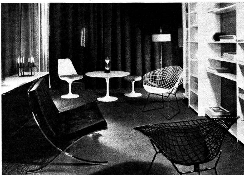
Le fameux fauteuil de cuir noir capitonné de Mies van der Rohe. Deux fauteuils en treillis de Bertoia. Au fond, une table ronde, une chaise et un pouf tournant de Saarinen.

voisiner aux côtés d'une authentique commode Louis XV. Comme un fauteuil d'Eames – bien qu'il fasse merveille en face d'une table basse de Mies van der Rohe – peut aussi s'allier sans réserve à un bureau de Boulle.