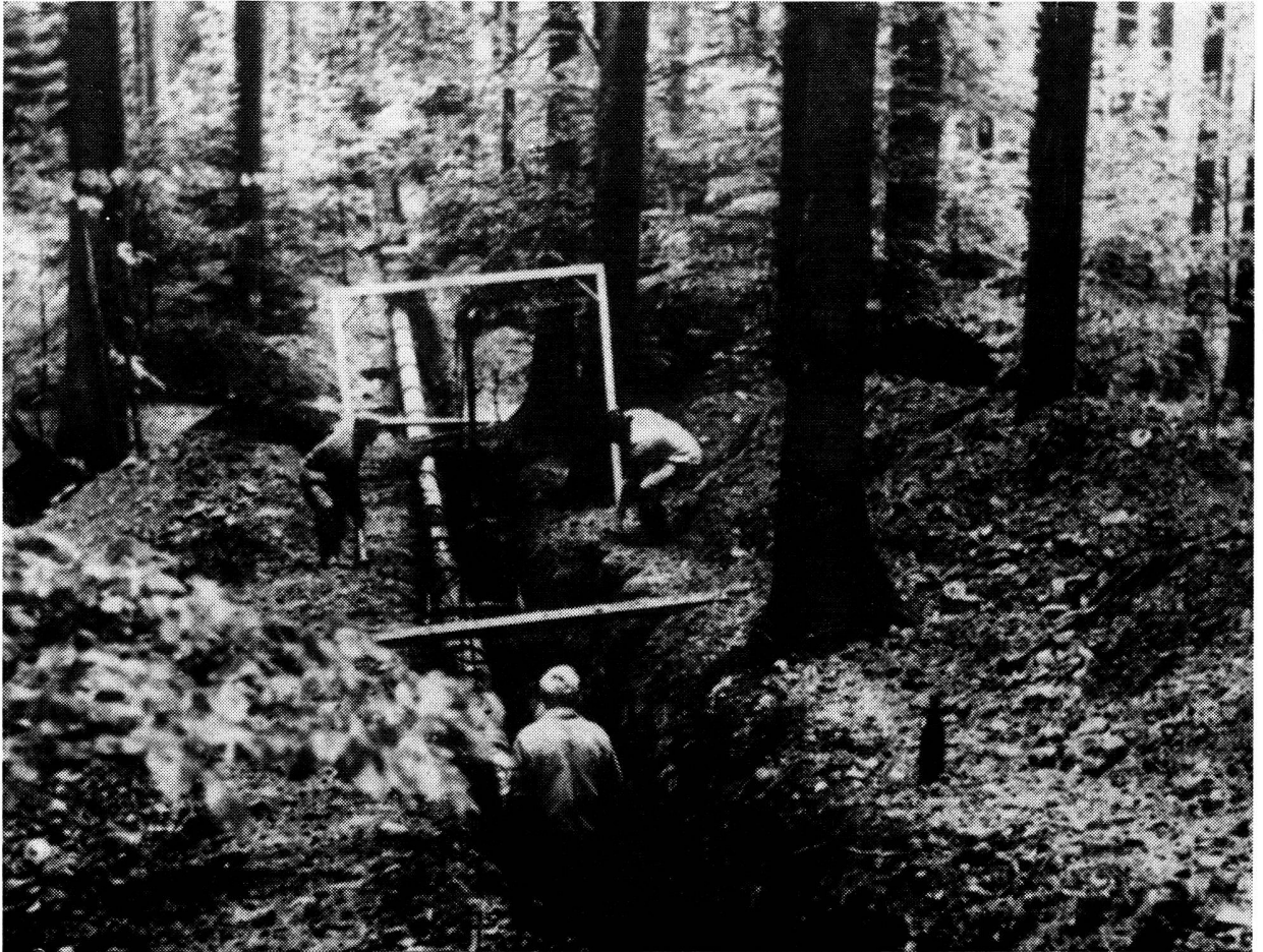
Pose de la conduite en amiante-ciment dans la forêt du Hühnli.

L'accroissement constant de la population de notre pays et les exigences de plus en plus grandes relativement aux installations hygiéniques et au confort placent les autorités compétentes devant des problèmes difficiles à résoudre lorsqu'il s'agit de capter de l'eau fraîche irréprochable. C'est ainsi qu'il y a quelques années la Commission des travaux publics et des transports de la commune de Muri, dans la banlieue de Berne, eut à s'occuper de l'extension du réseau existant de distribution d'eau. Jusqu'en 1962, Muri ne pouvait compter que sur un débit de 4650 litres/minute, se réduisant à 3200 litres/minute lorsque les circonstances étaient défavorables, ce qui est absolument insuffisant pour une commune s'étant déve-