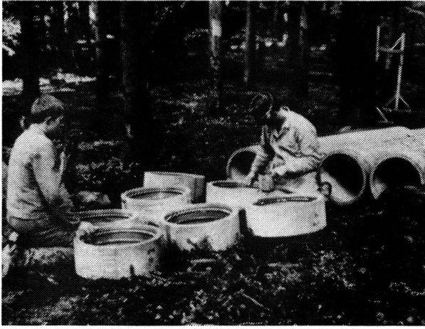
Insertion des anneaux de caoutchouc dans l'accouplement «Triplex» et badigeonnage avec un agent lubrifiant.

138 m. 25. Le puits de captage étant terminé, on effectua en juillet 1962 un essai de pompage durant trois jours: il en résulta un débit d'eau constant de 9000 litres par minute. L'agrandissement des deux réservoirs existants s'avéra, en plus de l'obtention d'un supplément d'eau, un travail de première urgence, vu que leur capacité n'était que de 1000 m 3 chacun. On décida donc l'agrandissement du réservoir Hühnli, dans la forêt du même nom, au-dessus des champs de Gümligen, ce qui fut réalisé en 1964. Le nouveau réservoir Hühnli a une capacité de près de 5000 m 3 . Une conduite de 400 mm. de diamètre amène l'eau du réservoir au réseau de distribution en passant par la forêt de Hühnli et le Gümligenfeld. En onze endroits la nouvelle conduite est reliée au réseau local existant. Ce fut la cause d'améliorations notables dans l'alimentation des régions situées aux environs de ladite conduite. Pour cette conduite d'amenée vers les régions habitées,