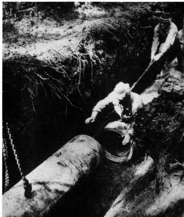
Assemblage des tuyaux en amiante-ciment dans la fouille.

on a choisi des tuyaux en amiante-ciment «Eternit». Ce matériau, utilisé à la fabrication de ces tuyaux, offre des avantages notables: son faible poids facilite les transports et la pose, ses nouveaux accouplements «Triplex» accélèrent le montage, et en plus les tuyaux d'amiante-ciment sont économiques. Comme l'amiante-ciment «Eternit» ne peut être sujet à l'électrolyse et qu'il offre une grande résistance aux agents chimiques, les tuyaux en amiante-ciment ont une grande longévité; ils durcissent de plus en plus avec le temps. Ces tuyaux-là ont fourni une fois de plus la preuve de leur efficacité lors de l'extension du réseau d'alimentation en eau potable de la commune de Muri près de Berne.