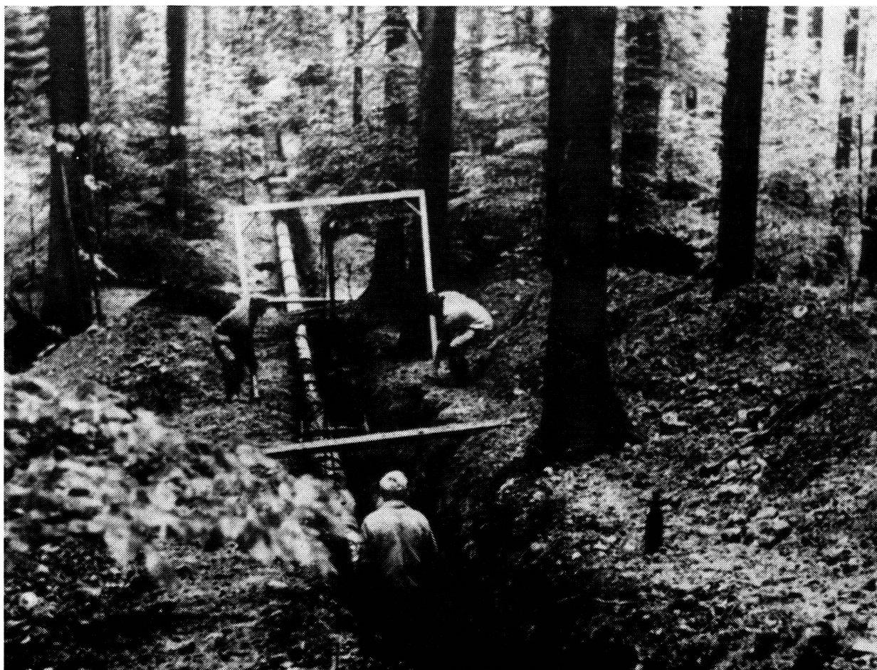
Pose de la conduite en amiante-ciment dans la forêt du Hühnli.

L'accroissement constant de la population de notre pays et les exigences de plus en plus grandes relativement aux installations hygiéniques et au confort placent les autorités compétentes devant des problèmes difficiles à résoudre lorsqu'il s'agit de capter de l'eau fraîche irréprochable. C'est ainsi qu'il y a quelques années la Commission des travaux publics et des transports de la commune de Muri, dans la banlieue de Berne, eut à s'occuper de l'extension du réseau existant de distribution d'eau. Jusqu'en 1962, Muri ne pouvait compter que sur un débit de 4650 litres/minute, se réduisant à 3200 litres/minute lorsque les circonstances étaient défavorables, ce qui est absolument insuffisant pour une commune s'étant déve-