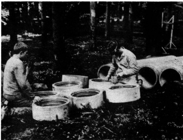
Insertion des anneaux de caoutchouc dans l'accouplement «Triplex» et badigeonnage avec un agent lubrifiant.

138 m. 25. Le puits de captage étant terminé, on effectua en juillet 1962 un essai de pompage durant trois jours: il en résulta un débit d'eau constant de 9000 litres par minute. L'agrandissement des deux réservoirs existants s'avéra, en plus de l'obtention d'un supplément d'eau, un travail de première urgence, vu que leur capacité n'était que de 1000 m 3 chacun. On décida donc l'agrandissement du réservoir Hühnli, dans la forêt du même nom, au-dessus des champs de Gümligen, ce qui fut réalisé en 1964. Le nouveau réservoir Hühnli a une capacité de près de 5000 m 3 . Une conduite de 400 mm. de diamètre amène l'eau du réservoir au réseau de distribution en passant par la forêt de Hühnli et le Gümligenfeld. En onze endroits la nouvelle conduite est reliée au réseau local existant. Ce fut la cause d'améliorations notables dans l'alimentation des régions situées aux environs de ladite conduite. Pour cette conduite d'amenée vers les régions habitées,