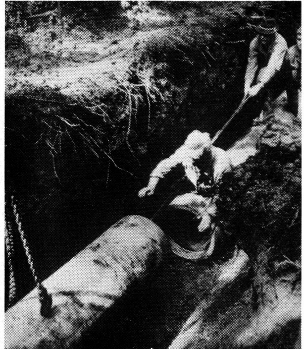
Assemblage des tuyaux en amiante-ciment dans la fouille.

on a choisi des tuyaux en amiante-ciment «Eternit». Ce matériau, utilisé à la fabrication de ces tuyaux, offre des avantages notables: son faible poids facilite les transports et la pose, ses nouveaux accouplements «Triplex» accélèrent le montage, et en plus les tuyaux d'amiante-ciment sont économiques. Comme l'amiante-ciment «Eternit» ne peut être sujet à l'électrolyse et qu'il offre une grande résistance aux agents chimiques, les tuyaux en amiante-ciment ont une grande longévité; ils durcissent de plus en plus avec le temps. Ces tuyaux-là ont fourni une fois de plus la preuve de leur efficacité lors de l'extension du réseau d'alimentation en eau potable de la commune de Muri près de Berne.