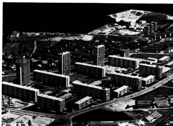
Vue d'ensemble du «Tscharnergut»

Nous passons par les différents ateliers de loisirs. Ce sont ceux que l'Hyspa, il y a quelques années, a exposés à Berne. Ils ont été replantés au «Tscharnergut». Il y a une forge, une menuiserie, un atelier de bricolage, un atelier de réparation de radio. Comme c'est mercredi