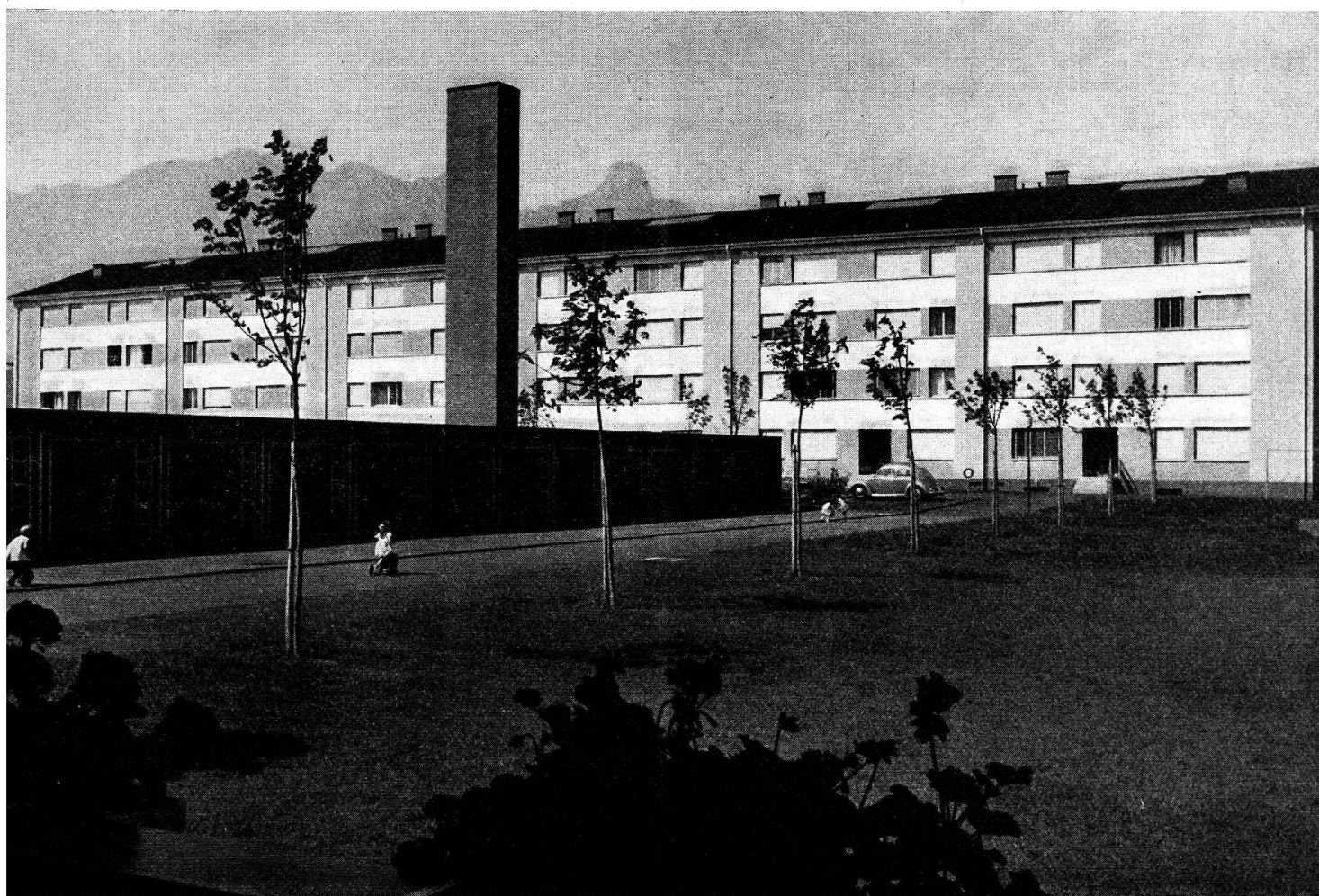
Coopérative d'habitation et de construction, Thoun.