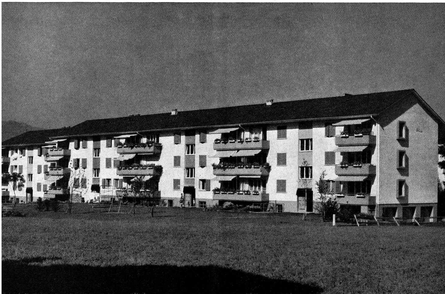
Coopérative d'habitation «Schwäbis», Steffisbourg.

années pourtant, les coopératives n'avaient mis sur le marché aucun nouveau logement; les permis de construire étaient accordés, la plupart du temps, à des sociétés anonymes sans siège à Thoune. C'est ce qui a conduit à la création de cette nouvelle coopérative qui put disposer d'un terrain communal de près de 1,2 ha. pour y ériger, sur la base d'un droit de superficie, une cité d'habitation de septante-deux logements.