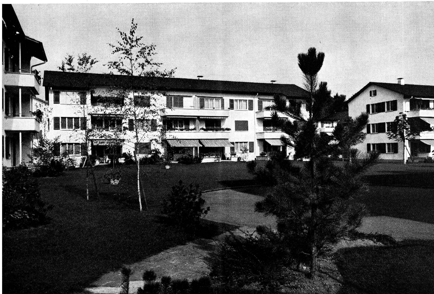
Coopérative d'habitation «Schönau», Thoune.

Nous donnons ici un aperçu de quelques intéressants travaux.