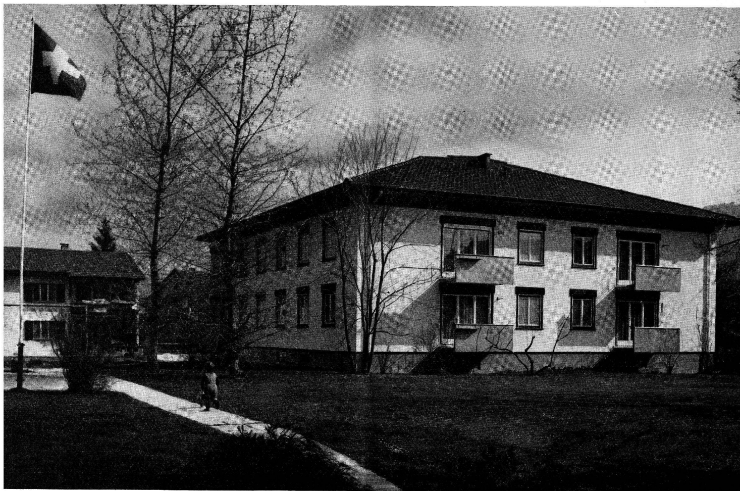
Coopérative de construction et d'habitation «Hohmad», 2 e étape 1955, Thounne.

C'est le grand développement de la motorisation de l'armée qui a amené un accroissement du personnel permanent du parc des véhicules motorisés de l'armée dont la direction prit contact avec les autorités en vue de la solution du problème; une coopérative en résulta, qui prit le nom de «Pro Familia» et qui réalisa, à partir d'octobre 1947, un certain nombre d'habitations pour le personnel de la Confédération. Cette coopérative construisit cinquante-quatre habitations de deux pièces et de quatre pièces et demie dans des blocs de trois niveaux à la périphérie de la ville. Le succès les amena à continuer et, dans le voisinage immédiat des premières, s'érigèrent, dans les années 1955 et 1956, quarante-huit autres logements.