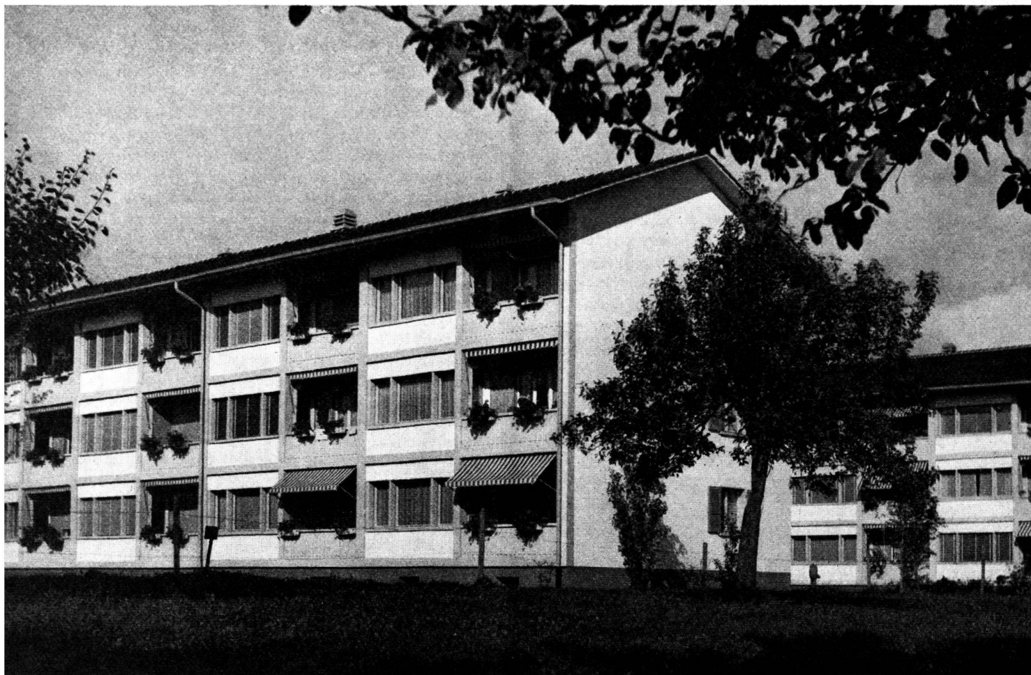
Cité «Wendelsee», Thouné.