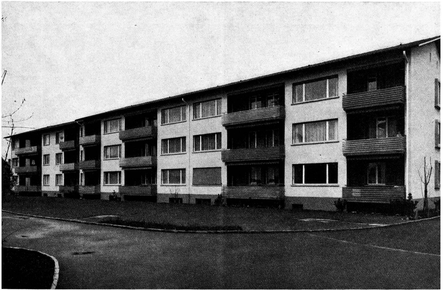
Coopérative d'habitation «Stern», Thoune.