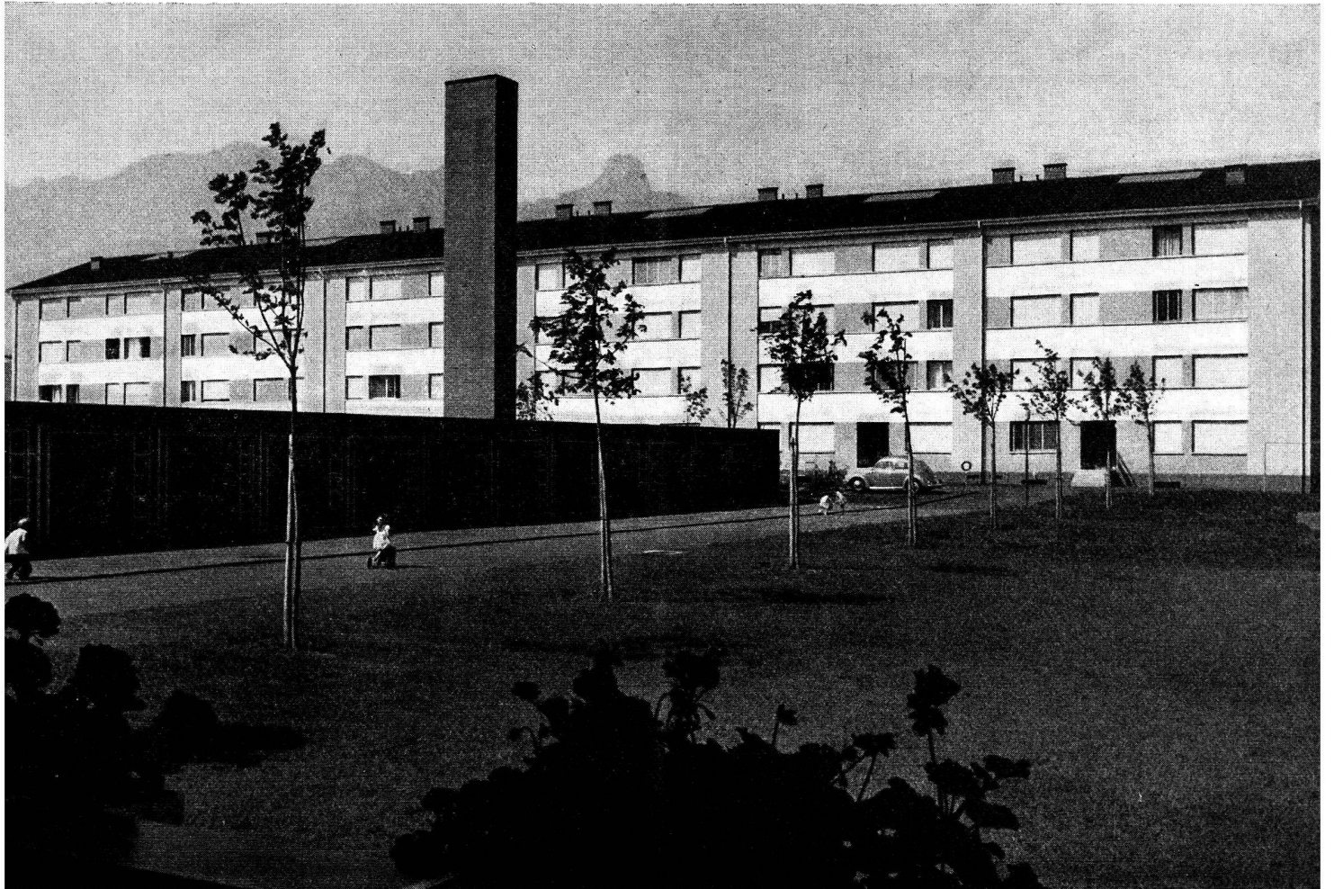
Coopérative d'habitation et de construction, Thoune.