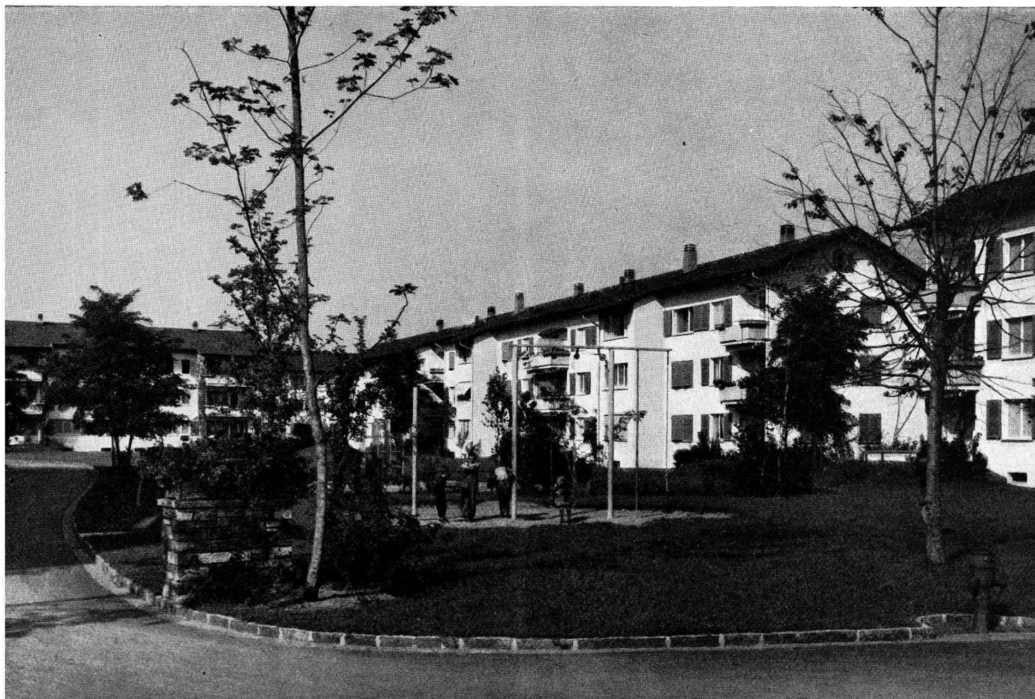
«Pro Familia», Thoune, 1 re étape.

La plus jeune des coopératives de la ville de Thoune a été créée en 1958 au moment où la construction coopérative en ville était au point mort. Dans cette ville, où plus de 86 % des contribuables sont salariés, un nombre considérable des logements doit être normalement mis sur le marché par les coopératives qui sont seules en mesure de ramener les loyers à un niveau supportable. Depuis des