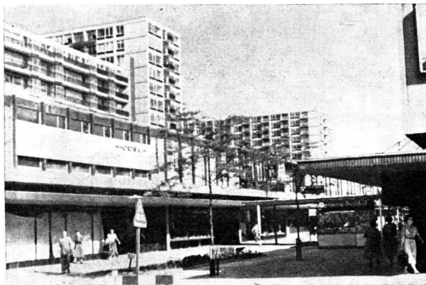
« Un mal qui s'étend comme un cancer... » Au lecteur d'en juger: une réalisation communautaire à Rotterdam... « Grand est l'égarement ! »

Nous pensons qu'il n'est jamais mauvais de connaître les arguments de ceux qui préconisent d'autres solutions que les nôtres. Nous avons extrait du Bulletin immobilier, organe de la Fédération romande immobilière, les lignes inquiètes que voici. Pour les rendre plus frappantes, nous les avons illustrées. (Réd.)