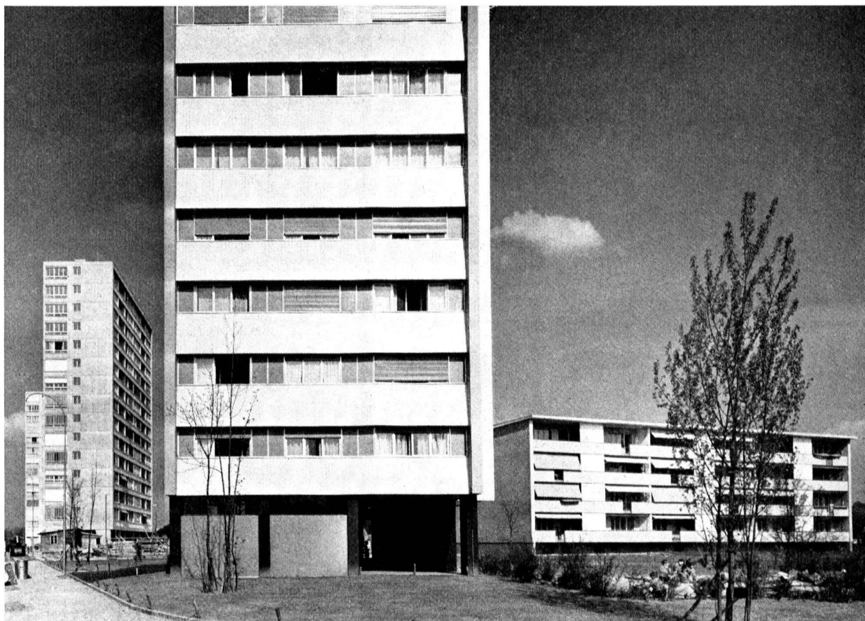
Vue depuis l'ouest.

Le trafic est concentré dans une route circulaire qui fait le tour de la cité.