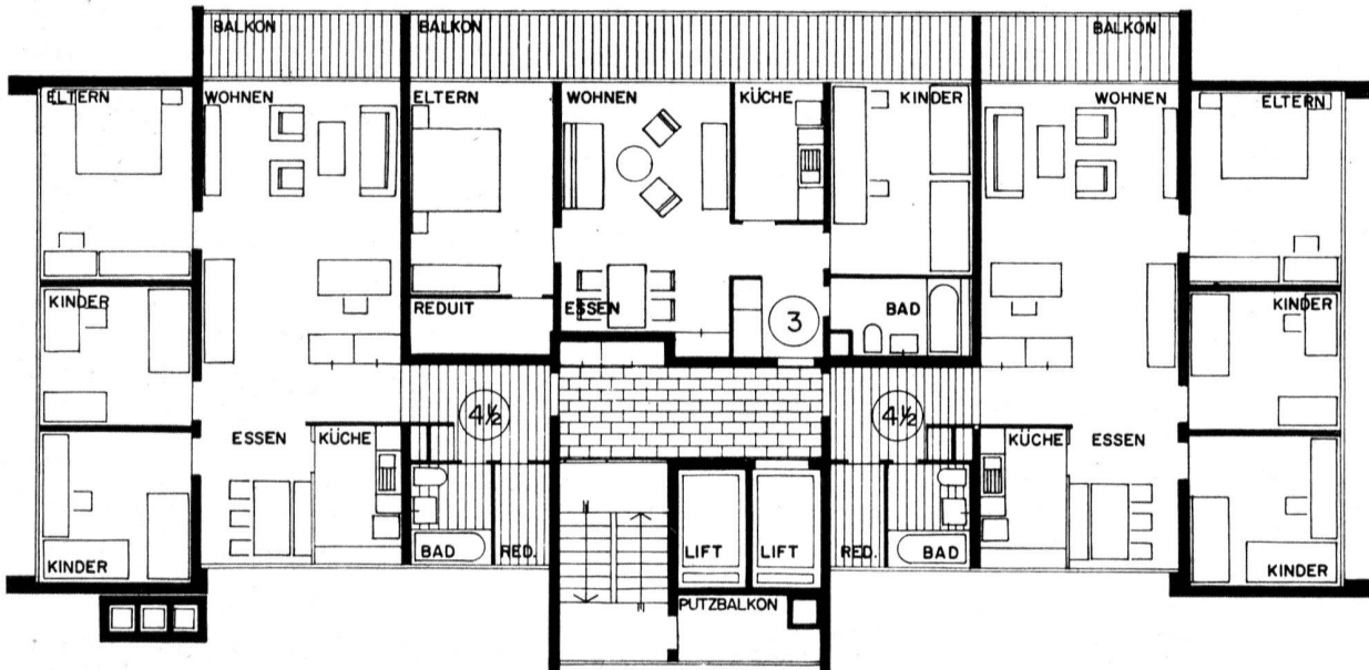
Plan d'un étage normal des maisons-tours. Echelle env. 1 : 170.

La première étape de la Cité Ausserholligen est terminée. Ce n'est, cependant, qu'à l'achèvement de l'ensemble qu'apparaîtront les avantages de la conception générale.