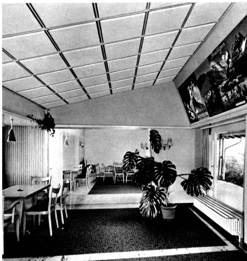
◀ Salle commune