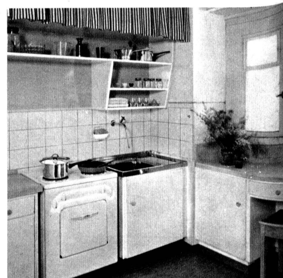
Cuisine d'un logement