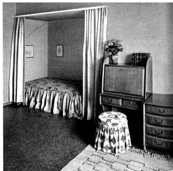
Chambre à un lit