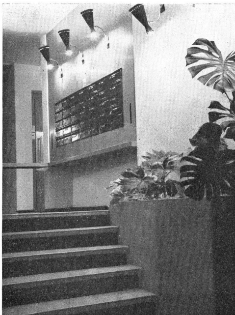
Entrée de l'immeuble.