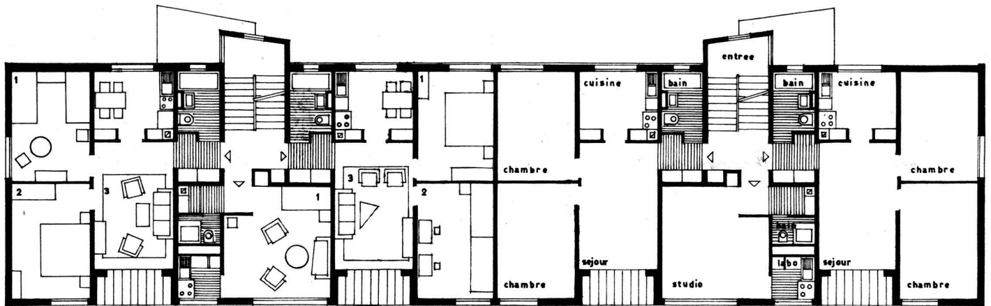
plan des etages des batiments a-b