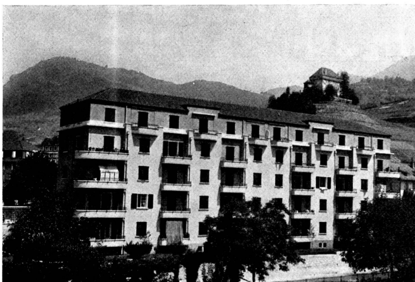
« Les Bouleaux » construit en 1932, 20 appartements de 3 pièces, 10 de 2 pièces chauffage central et eau chaude par appartement.