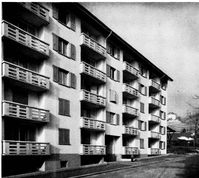
« Les Lauriers » 20 appartements de 1, 2, 3, et 4 pièces.

et un au-dessus de Montreux, Les Trois Tilleuls , de seize appartements de deux, trois et quatre pièces. Grâce aux soins attentifs de notre architecte, nous avons pu, dans le cadre des crédits accordés, installer le chauffage central et l'eau chaude générale, ainsi que des tentes à chaque balcon.