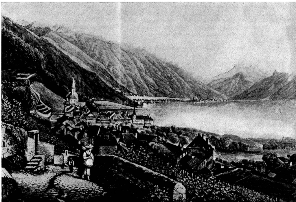
Montreux, il y a cent ans. (D'après une ancienne gravure, photo J. M. Schlemmer.)

toire des documents écrits : antiques parchemins et poudreux registres des archives épiscopales. Car l'archéologie nous fait remonter infiniment plus haut. Elle nous signale la présence, il y a... six mille ou dix mille ans,