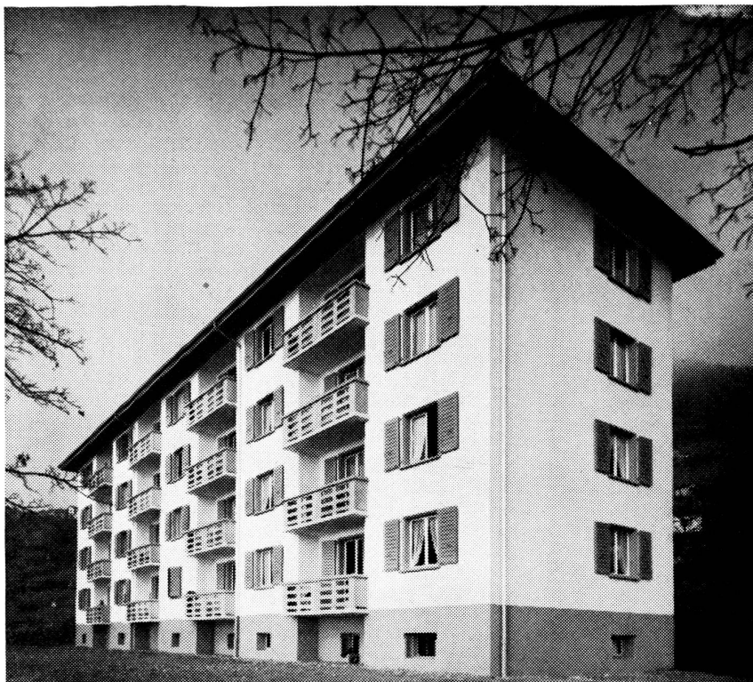
« Les Trois Tilleuls » 16 appartements de 2, 3 et 4 pièces.

immobiliers de la région donna lieu à une campagne mémorable où tous les moyens furent mis en œuvre pour faire avorter notre projet. Ce fut l'occasion d'entendre cette énormité de la part d'un médecin montrousien : « ... qu'est-ce que c'est que cette légende de baignoires pour des ouvriers?... ». On a évolué depuis !