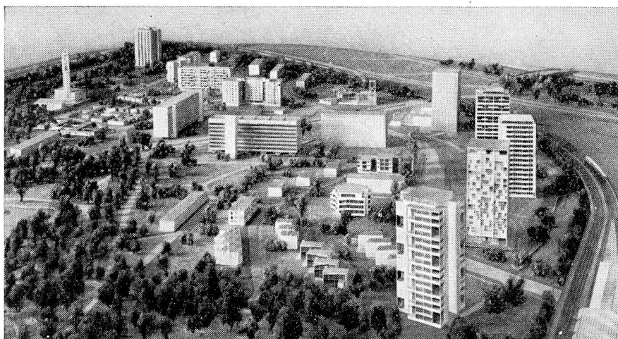
Maquette montrant la partie sud du quartier Hansa, vue de l'est.