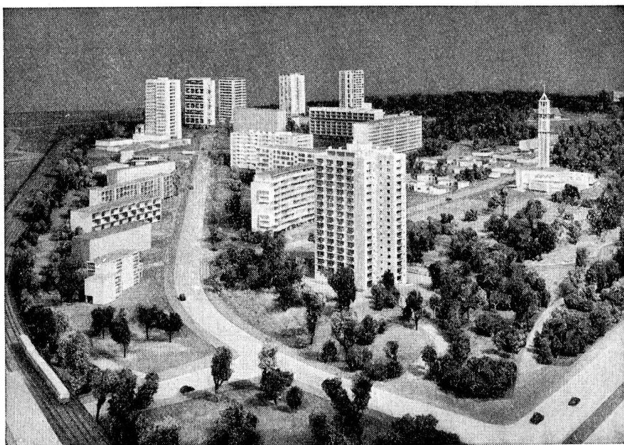
Détail montrant le sud du quartier Hansa, vu du sud-ouest.