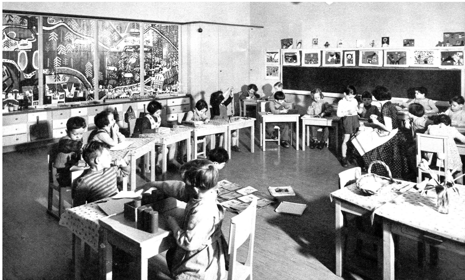
26. CLASSE ENFANTINE. A GAUCHE: PARTIE VITRÉE ENTRE CLASSE ET CORRIDOR. ON APERÇOIT, DERRIÈRE LES VITRES, LA GRANDE FRESQUE (24 M. x 3 M.) CONÇUE PAR LES ÉLÈVES DU PETIT-PRÉLAZ ET REPRODUITE FIDÈLEMENT PAR MM. CLAVEL ET PETTINEROLI. CI-DESSOUS: 27. LA MÊME CLASSE, PHOTOGRAPHIÉE DU VESTIBULE.