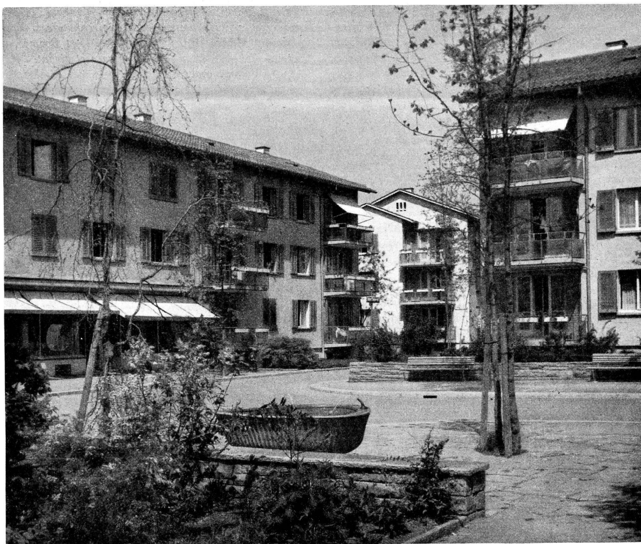
Colonie municipale d'habitation « Im Herrlig », Zurich 1946. Aeschlimann et Baumgartner, Schaer et Gisel, architectes.

« Notre économie nationale est caractérisée par ses éléments justement différenciés et gradués dans leur importance. A côté des grandes exploitations industrielles se maintiennent de plus petites, de même qu'un artisanat