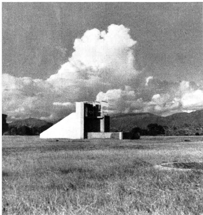
Tribune en béton destinée au premier ministre pour la cérémonie d'inauguration.

avancés. Il y a aussi des maisons construites par des particuliers, assujettis à un certain contrôle. Dans le secteur 16 existent déjà l'Université, le Technicum, le Foyer des étudiants, l'Hôtel des Fonctionnaires, alors que le groupe du Capitole, exclusivement élaboré par Le Corbusier, n'en est encore qu'au début de sa construction. Situé au nord de la ville, avec l'Himalaya comme arrière-plan, doit comporter les grands édifices gouvernementaux. Au centre de la ville, les immeubles d'affaires sont à plusieurs étages, alors que les quartiers d'habitation ont des maisons de un ou deux étages seulement. Partout, la plus grande importance est vouée aux cours car, vu le climat, on dort en plein air une partie de l'année. La protection contre le soleil est très étudiée. Le Corbusier a même conçu un « parasol » en béton au-dessus du Palais de justice. Très coloré et ornemental, l'ensemble, qui préfigure un changement profond dans les habitudes de vie de la masse, servira sans aucun doute de fécond exemple au point de vue de l'évolution future de l'Inde. (Les renseignements techniques contenus dans ces quelques notes, sont extraits de la revue Das Werk qui, dans son numéro 5/1955, a publié une étude très complète et très documentée sur Chandigarh, par deux jeunes architectes suisses, Hans et Karihana Frei. Et ci-après, nous donnons la traduction de l'étude de M. Kell Aström, extraite, avec les clichés, de la revue Byggmästaren .) J.