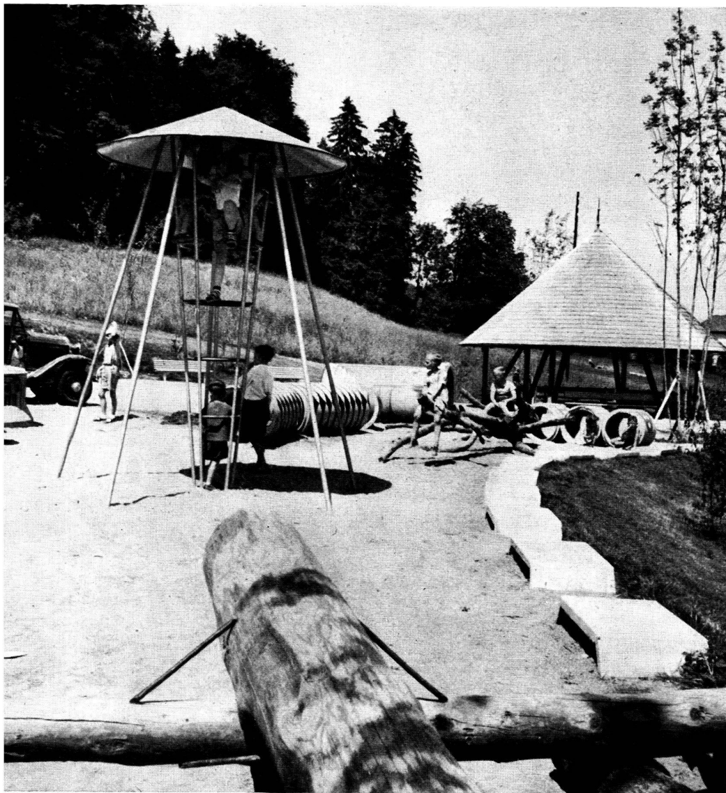
Quelques aspects de la place de jeux pour enfants «Sonnengarten», à Zurich.