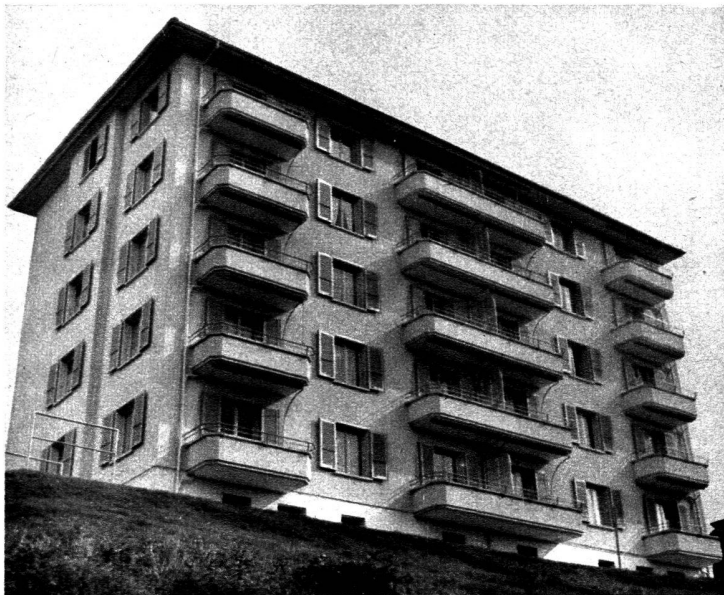
L'immeuble N° 55-57.