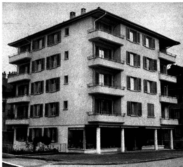
L'immeuble N° 58.