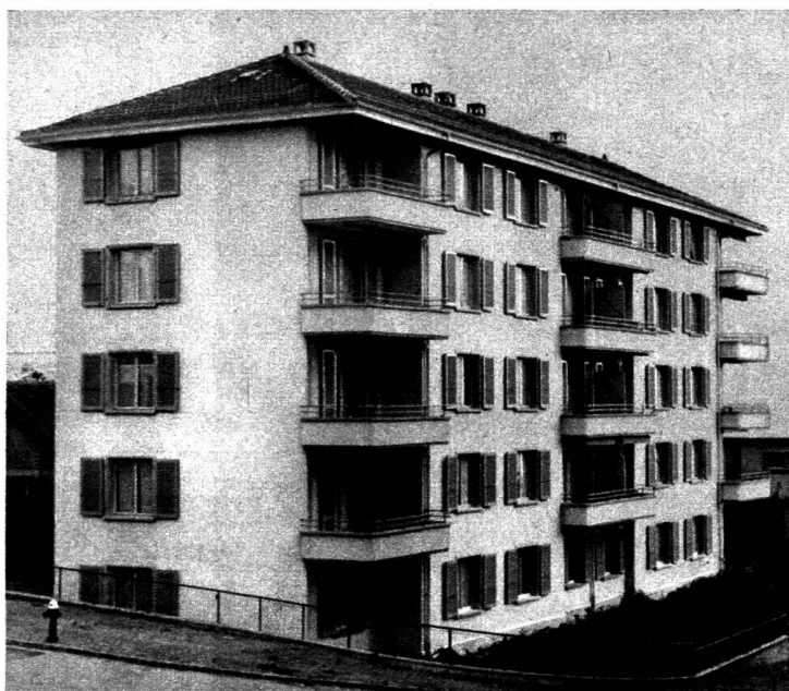
L'immeuble N° 45-47.