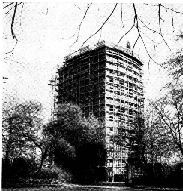
Vue du bloc central, depuis le Kannenfeld-Gottesacker.