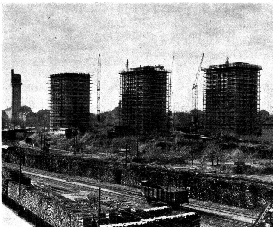
L'ensemble des maisons-tours en construction. A gauche, l'église Saint-Antoine.

en terrains à bâtir, avec une superficie de 370 000 ares seulement, en comprenant encore dans ce chiffre les communes de Riehen et de Bettingen. Il n'en reste pas moins vrai que les constructions mixtes sont celles qui satisfont le plus grand nombre de catégories de locataires. Sur un terrain étroit, qui est bordé par la Mittlere Strasse, d'un côté, et par le train d'Alsace, de l'autre, et qui possède une vue libre sur la Kannenfeldplatz et sur le Gottes Acker, qui sera transformé en plage dans ces prochaines années, on pouvait, sans autre, choisir la formule des maisons en hauteur. Les distances entre voisins sont étudiées de telle façon que l'on a ainsi une meilleure vue que si l'on avait construit des logements selon le plan de zones traditionnel.