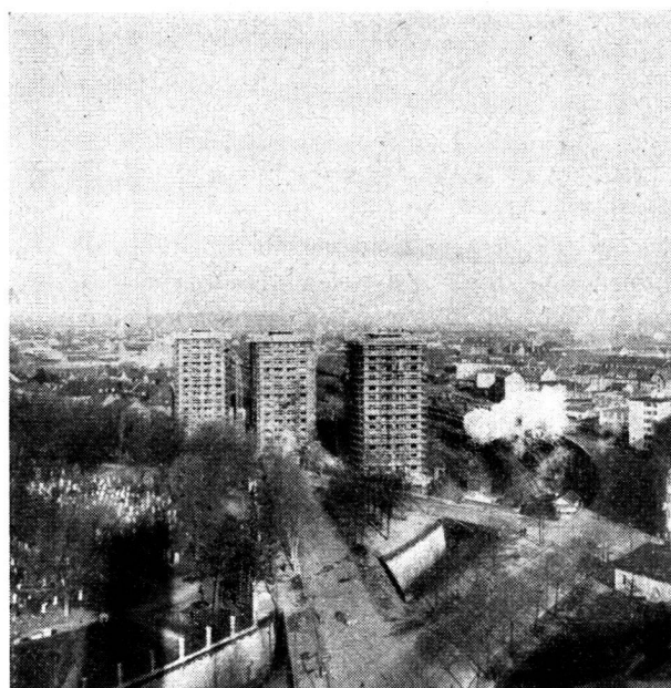
Vue générale des trois maisons-tours, depuis le clocher de l'église Saint-Antoine.

L'isolation phonique a été particulièrement étudiée : tous les matériaux d'isolation et autres ont été choisis sur de vastes essais ; on ne trouvera pas, en particulier,