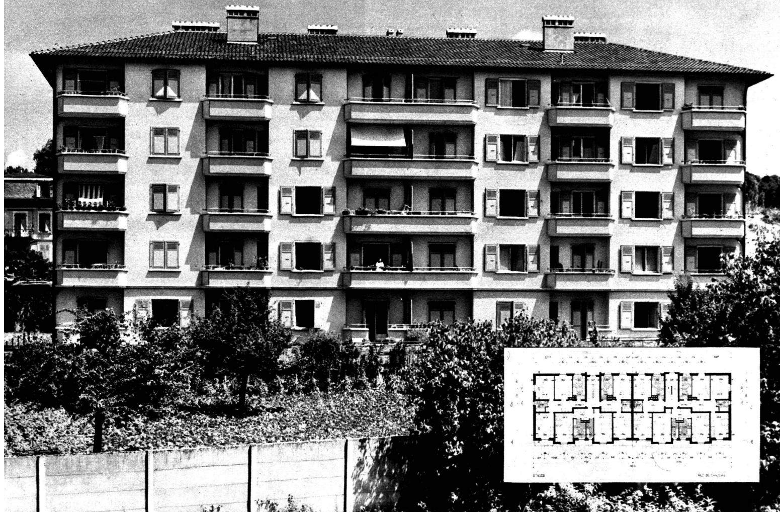
Façade principale de l'immeuble.