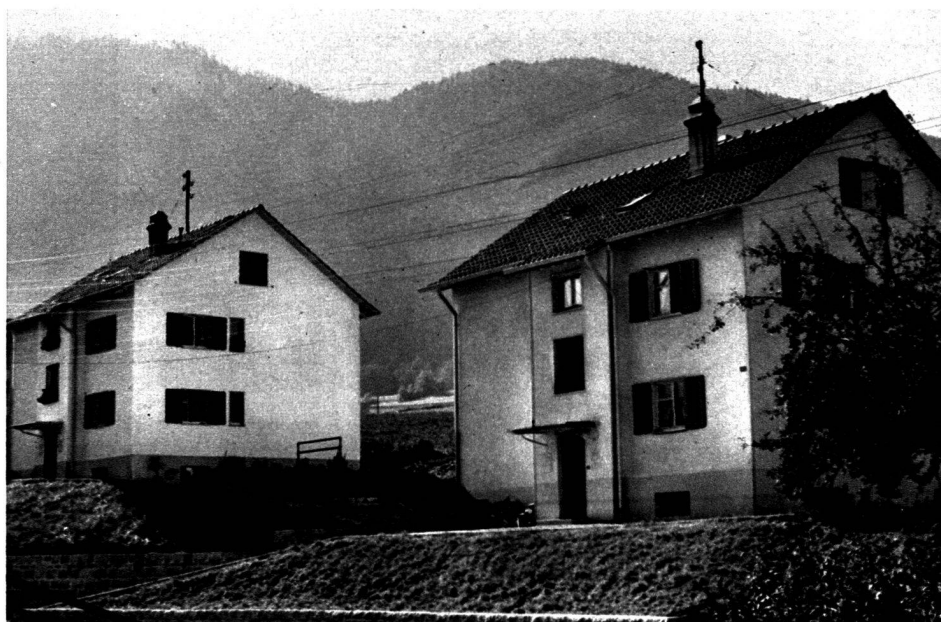
L'entrée des immeubles.