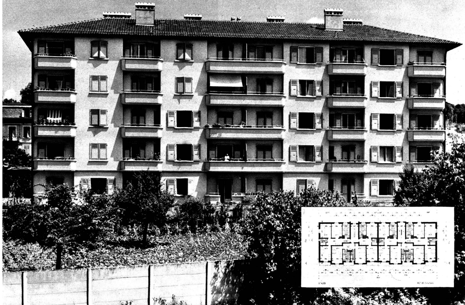
Façade principale de l'immeuble.