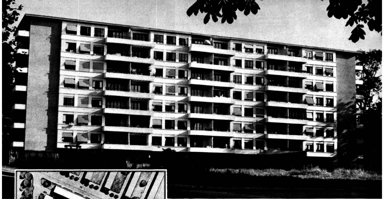
Immeuble du Groupe K, construit en 1947-1948. Façade sud-est.