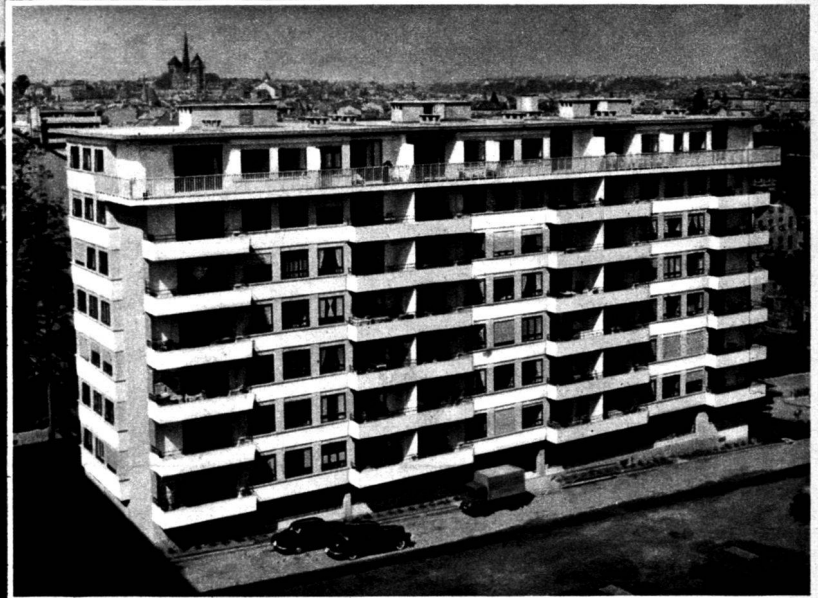
Le Groupe L, construit en 1948-1949. Façade sud-ouest.