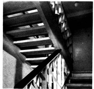
Rampe d'escalier en éléments préfabriqués.