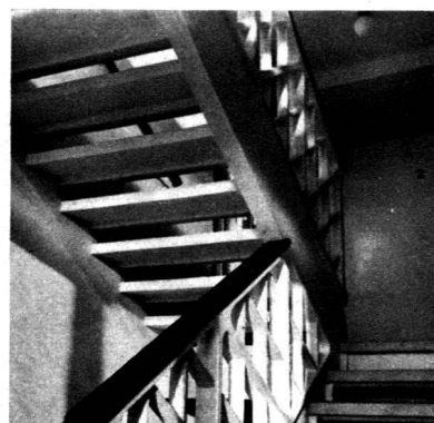
Rampe d'escalier en éléments préfabriqués.