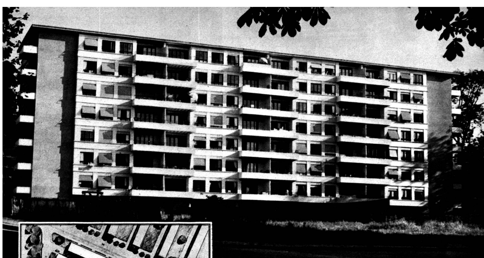
Immeuble du Groupe K, construit en 1947-1948. Façade sud-est.