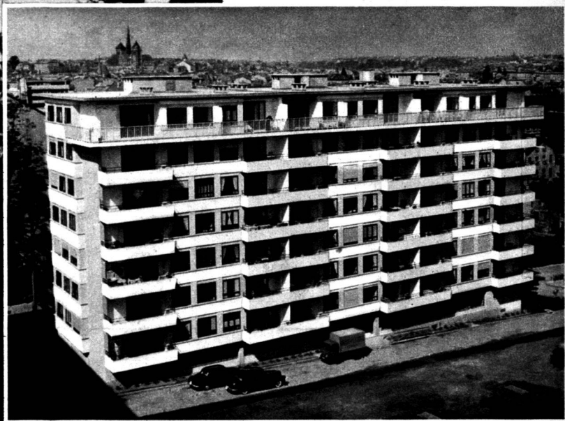
Le Groupe L, construit en 1948-1949. Façade sud-ouest.