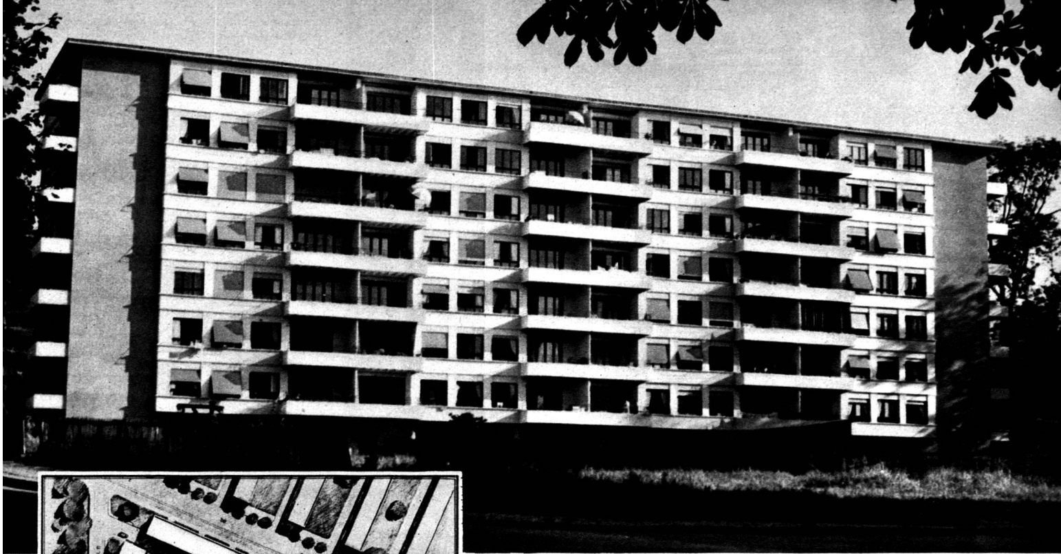
Immeuble du Groupe K, construit en 1947-1948. Façade sud-est.