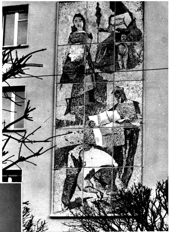
Mosaïque de la façade de la Banque Cantonale du Valais, à Martigny. 7 m. 50 de haut, 3 m. de large. Pierres du Rhône.