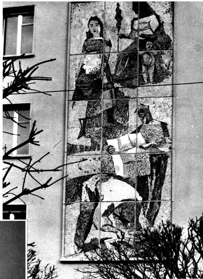
Mosaïque de la façade de la Banque Cantonale du Valais, à Martigny. 7 m. 50 de haut, 3 m. de large. Pierres du Rhône.