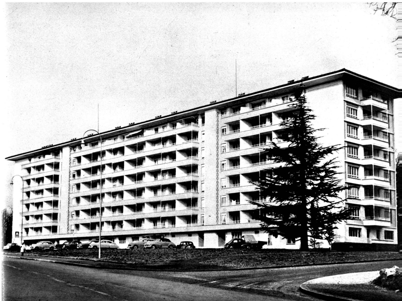
Vue générale de l'immeuble, façade ouest.