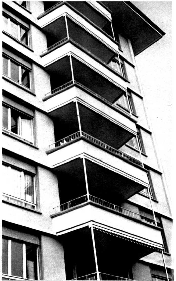
Vue de la grande façade.