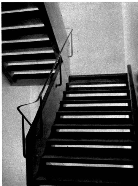
Détail de l'escalier.