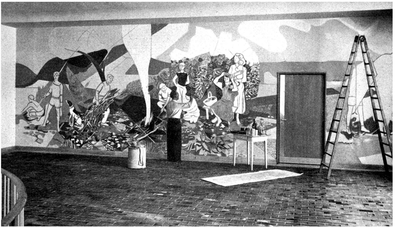
Le peintre Holy travaille à sa grande peinture murale représentant les quatre éléments, illustrés par des activités enfantines.