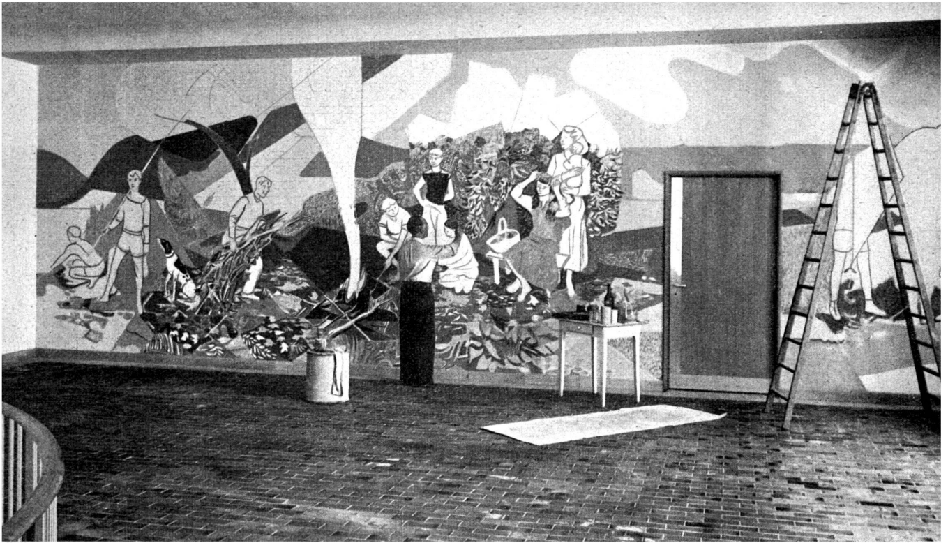
Le peintre Holy travaille à sa grande peinture murale représentant les quatre éléments, illustrés par des activités enfantines.