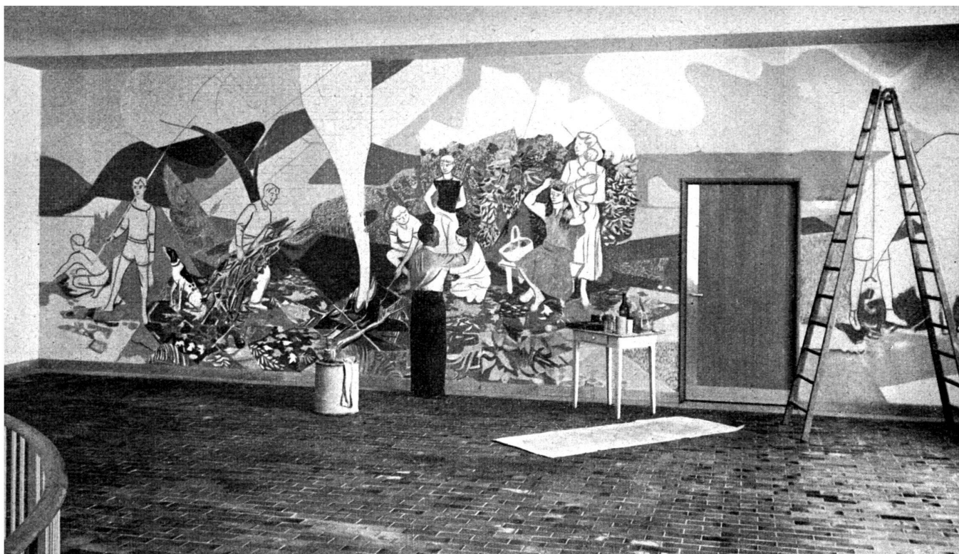
Le peintre Holy travaille à sa grande peinture murale représentant les quatre éléments, illustrés par des activités enfantines.