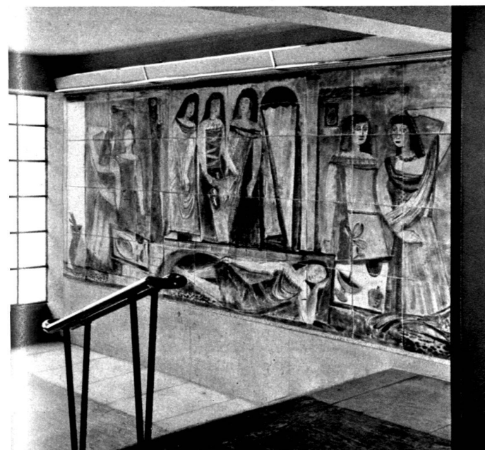
Mascarin. Décoration en carreaux de céramique.