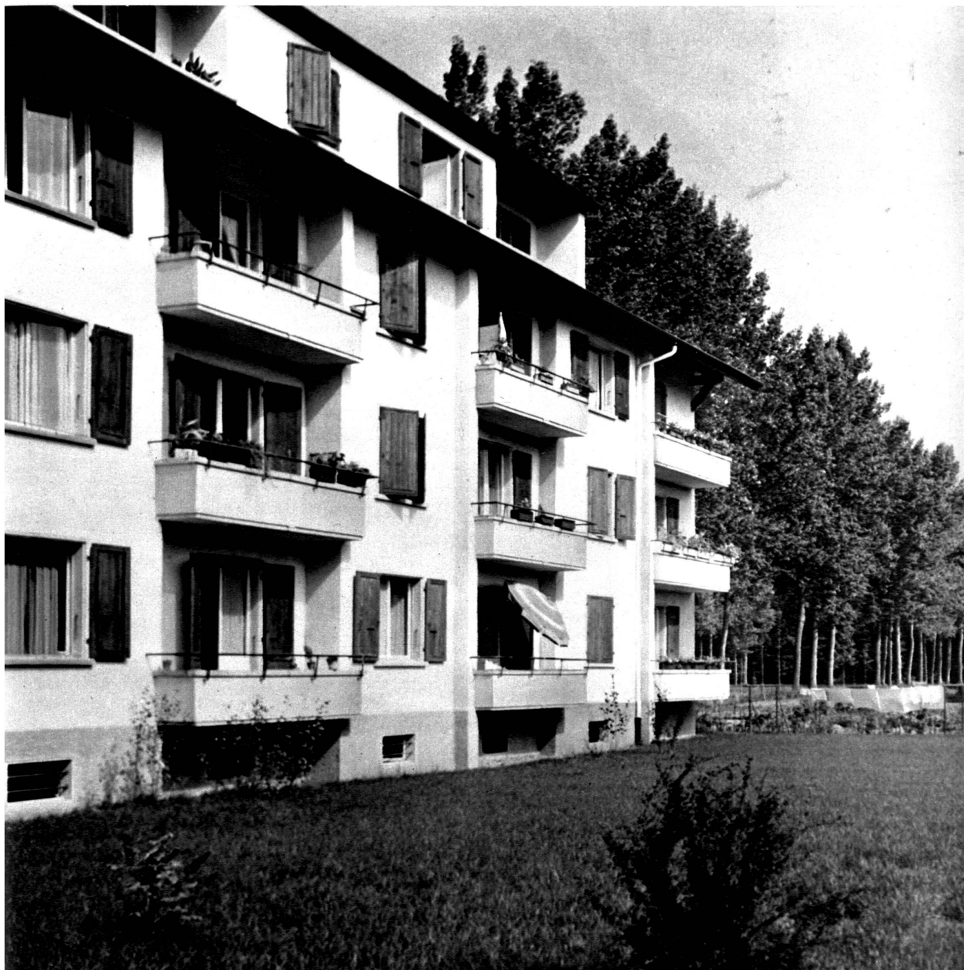
Vue du bâtiment 1.