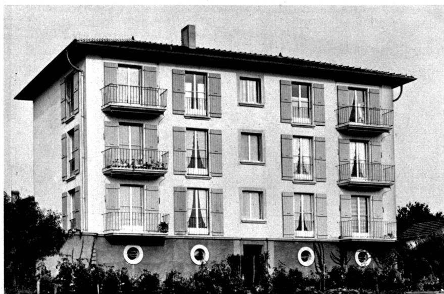
Élévation côté jardin d'un des bâtiments.