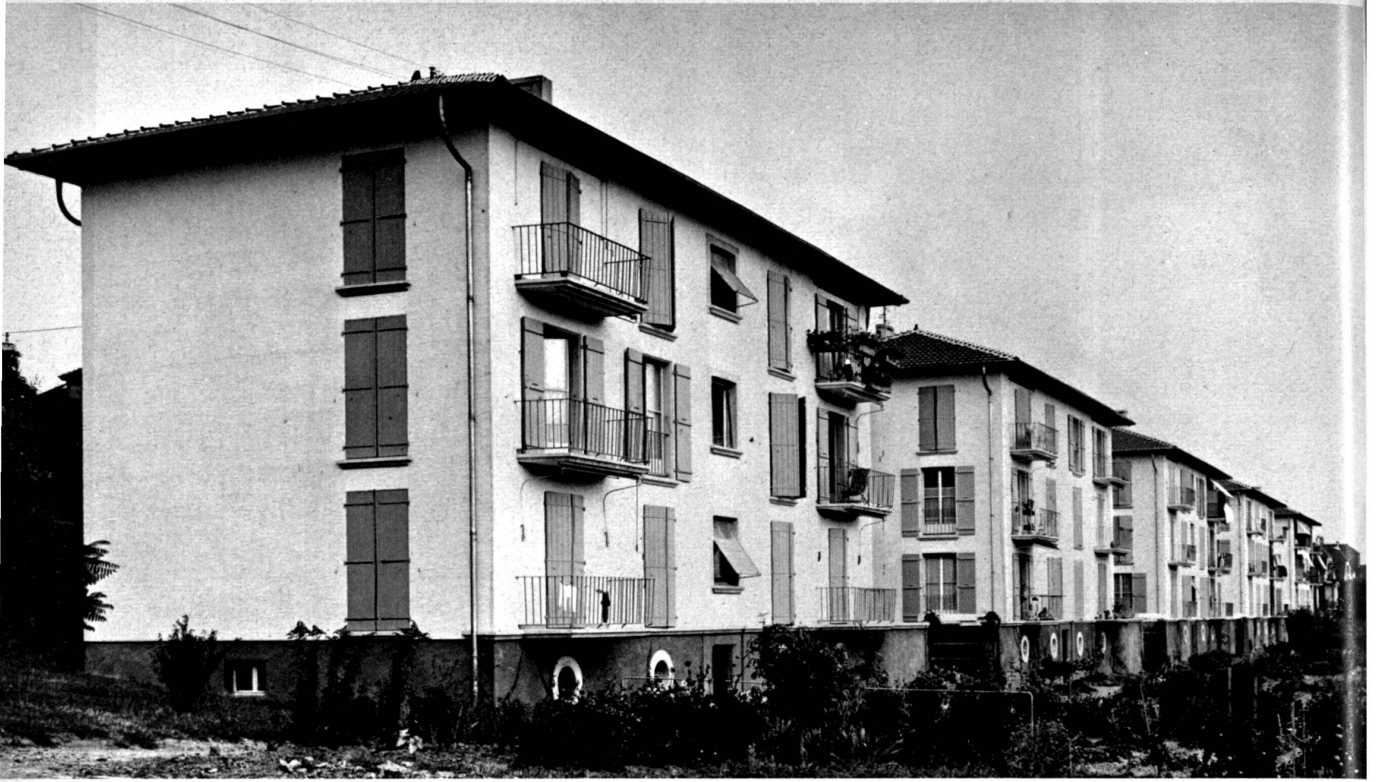
Vue d'ensemble côté jardins.