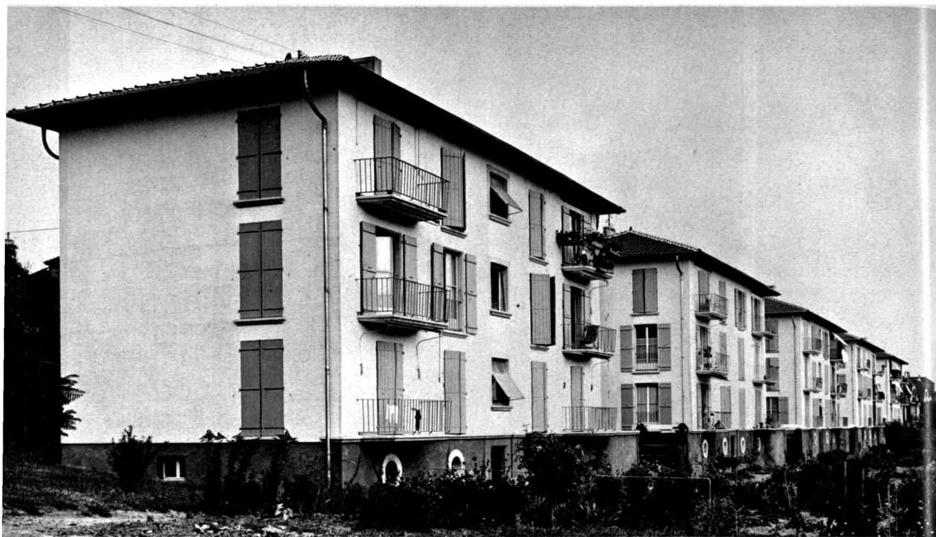
Vue d'ensemble côté jardins.