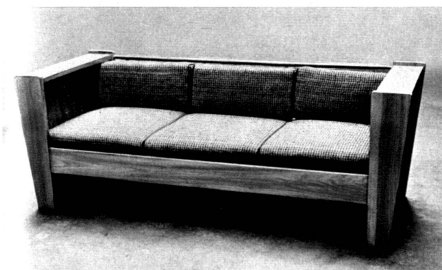
Sofa-lit d'enfant. P. Trosser, arch.