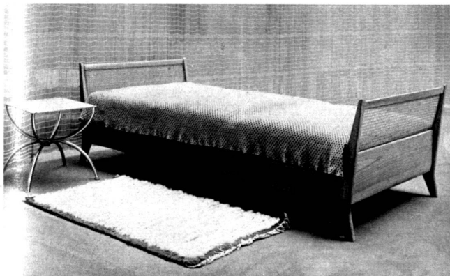
Lit bois et osier, de Johannes Krahn, architecte. Table de Gerhard Weber.