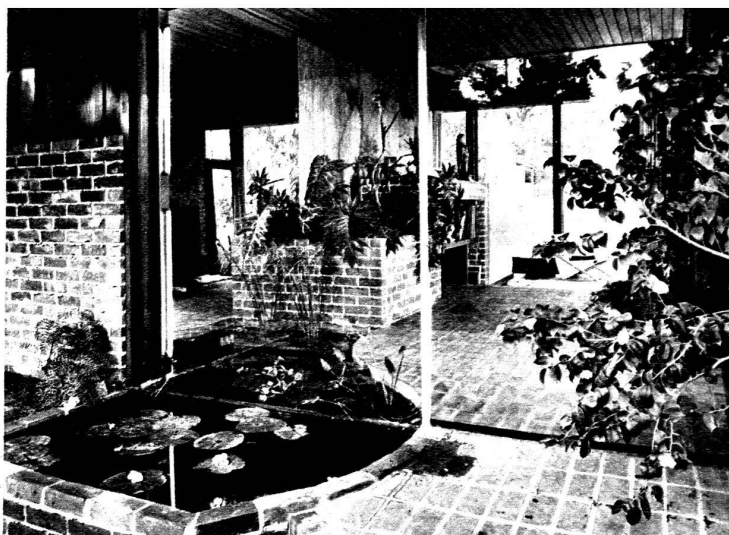
Villa de J. Nesbitt. Un grand miroir, à gauche, agrandit la pièce.