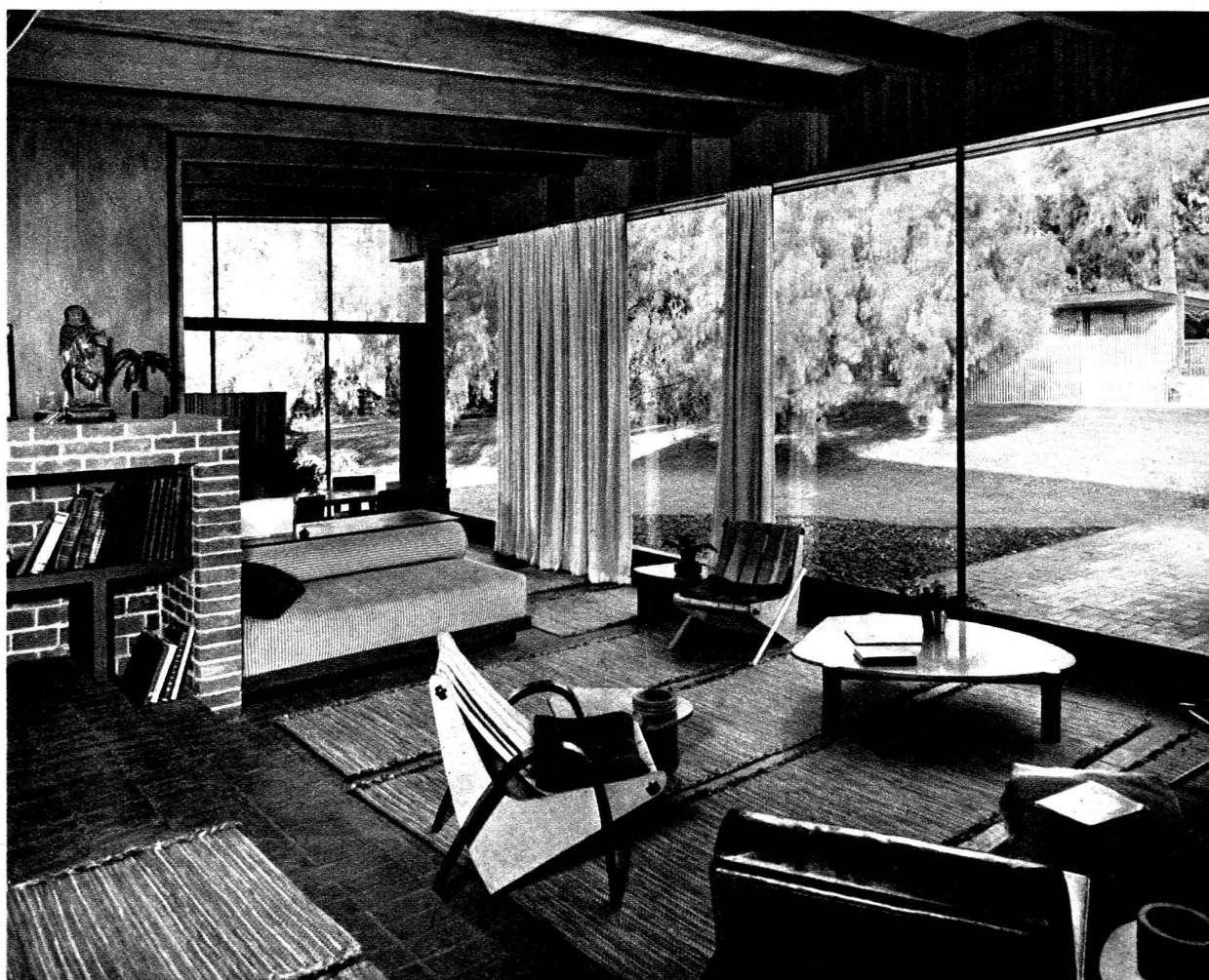
Villa de J. Nesbitt, à Brentwood, Californie. La pièce de séjour. Au fond, la salle à manger. Plafond en bois. Sol en briques.