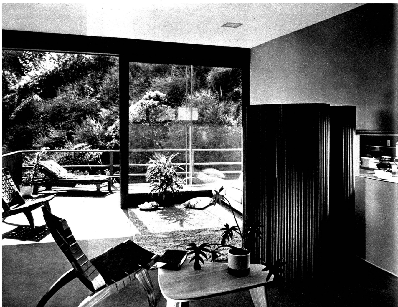
Villa de J. Sinay, à Beverly Hills, Californie. Pièce de séjour d'une petite villa. A droite, la cuisine, d'où l'on peut facilement servir les repas sur le balcon.