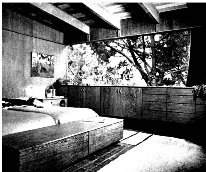
Villa de J. Nesbitt. La chambre à coucher.