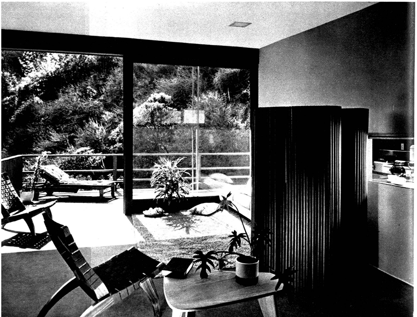
Villa de J. Sinay, à Beverly Hills, Californie. Pièce de séjour d'une petite villa. A droite, la cuisine, d'où l'on peut facilement servir les repas sur le balcon.