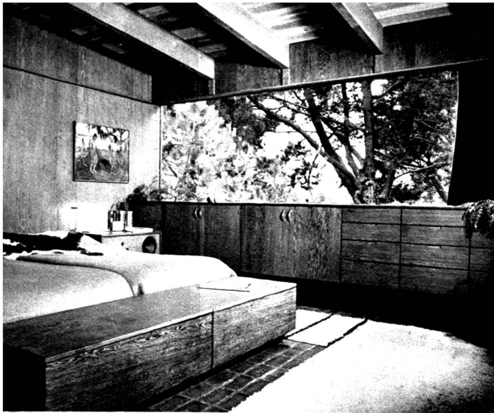
Villa de J. Nesbitt. La chambre à coucher.