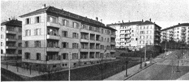
Ci-dessus : Ensemble des groupes d'Ouchy des 1 er et 2 e périodes. Au premier plan, l'avenue de la Harpe. Au second plan, le groupe I construit en 1935-1936. Au fond, le groupe d'Ouchy de la Société coopérative d'habitation construit en 1933.