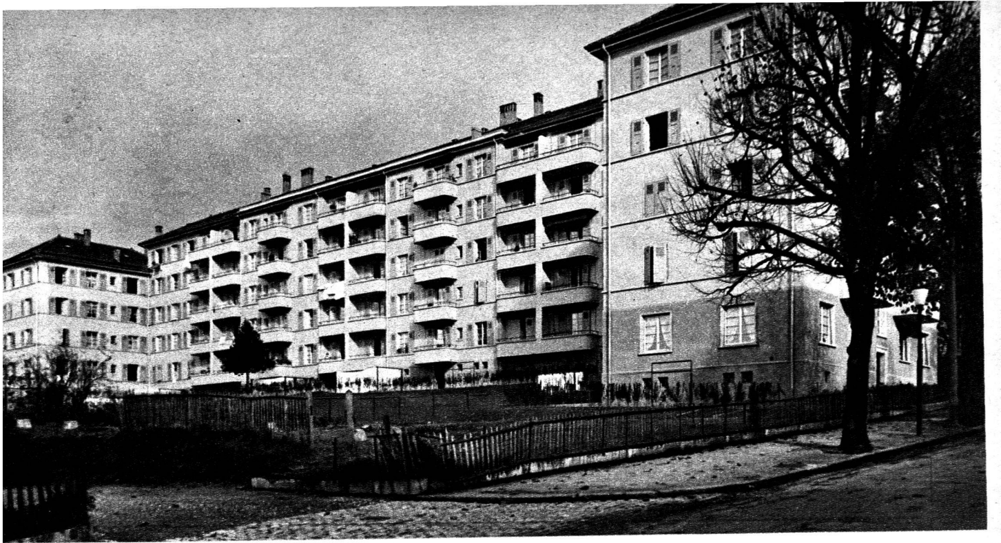
En haut : 1936. Le Logement ouvrier, au chemin Pidou, à Ouchy, rivalise d'aspect avec les grandes maisons locatives qui ont envahi la zone urbaine de Lausanne. (Fondation du Logement ouvrier.)