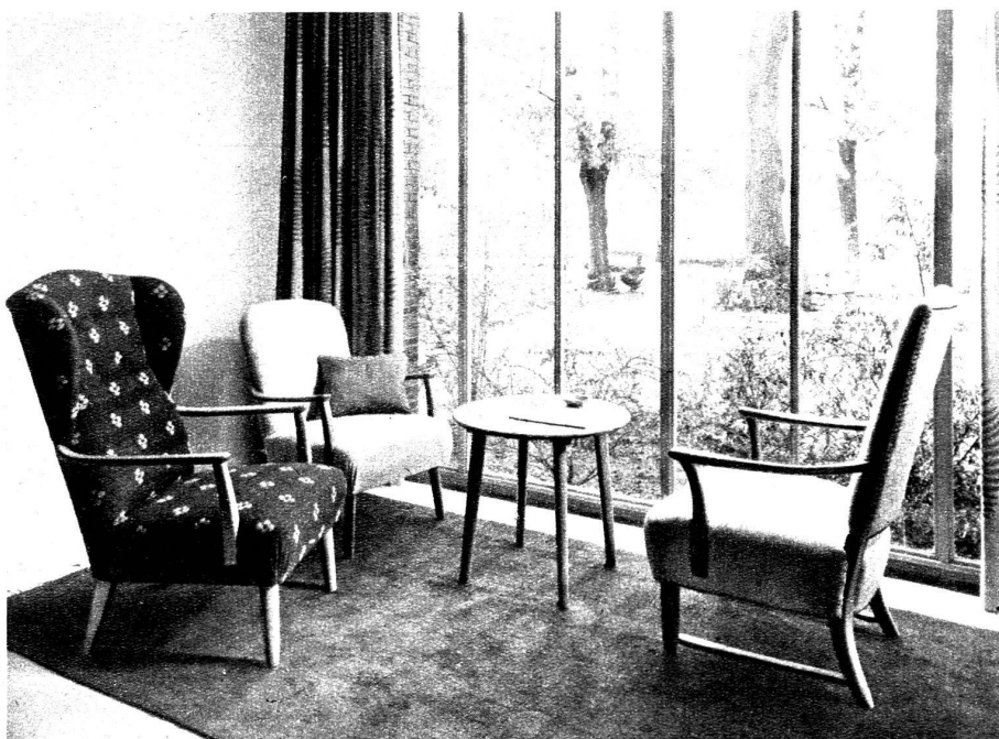
Document Tr. Simmen.

L'étude du logement de demain, dont la maison familiale n'est qu'un des aspects, et celle infiniment plus importante, quoique plus éloignée de nous, de la reconstruction des millions de foyers dévastés par la guerre, ne sauraient se concevoir sans l'étude conjointe et simultanée d'un mobilier adapté à cette destination. De même que la villa façon hôtel particulier doit laisser la place à une maison simple en rapport avec les moyens financiers du propriétaire, de même la salle à manger Henri II, le salon et la chambre à coucher style Dufayel qui sévissent encore ne doivent plus être demain qu'un mauvais souvenir. Mais il y a encore fort à faire dans ce domaine. Certes, les fabricants de meubles font un effort louable, et quelques-uns des exemples que nous reproduisons ici indiquent qu'on s'est engagé déjà sur le bon chemin. Ce n'est pas assez. Le goût du public, on doit hélas le dire, se porte encore trop facilement vers le clinquant, vers le faux style, vers le meuble « bourgeois arrivé » ou vers le soi-disant « rustique » dont l'offensive semble heureusement à bout de souffle. Et le décorateur, lui, erre à la recherche d'une originalité insupportablement artificielle, elle aussi. C'est à une épuration des formes que nous voulons arriver, et l'évidence finira par s'imposer que la qualité essentielle d'un mobilier bon marché réside dans sa simplicité.