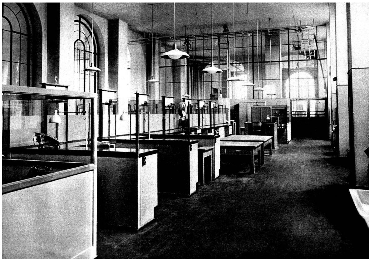
Hall des guichets (côté service).