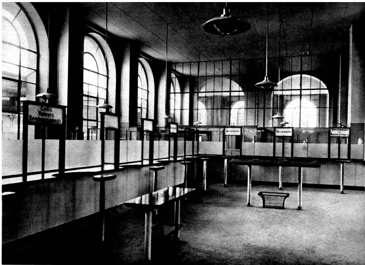
Hall des guichets.