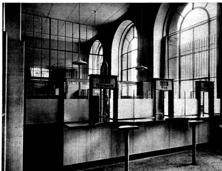
Hall des guichets.

Au rez-de-chaussée et au premier étage, une modification importante a été réalisée par la pose de faux plafonds diminuant le cube des locaux et donnant un meilleur rendement du chauffage.