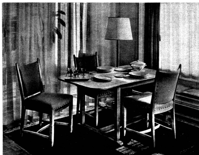
Au-dessus : Table à manger dépliant avec sièges rembourrés, bois de noyer clair mat et tissu beige clair sur tapis tête de nègre.

Qu'à des formes plaisantes à l'œil il sache unir l'heureux équilibre des masses et l'agréable im-