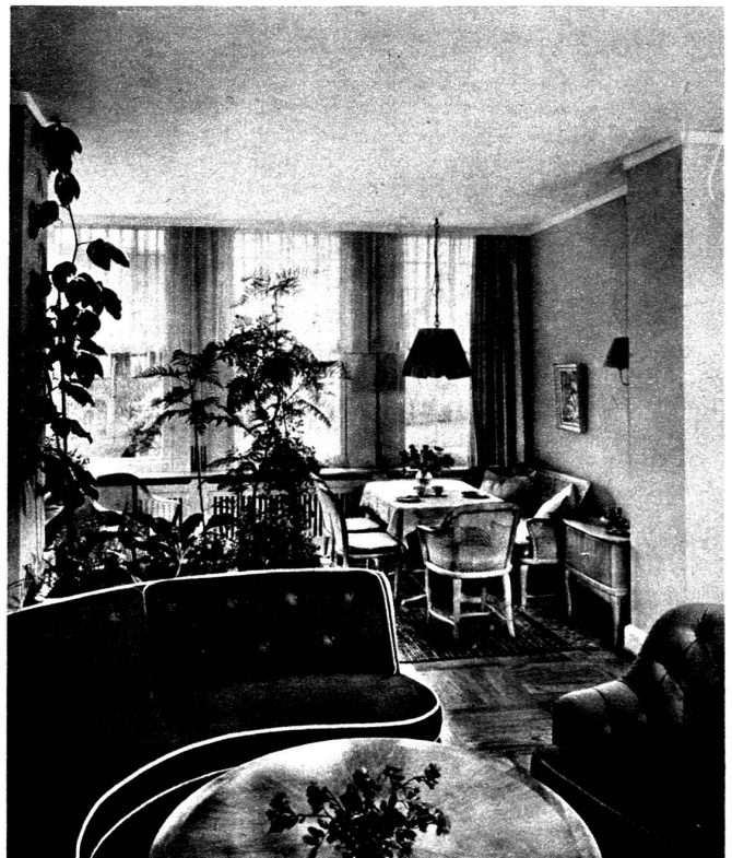
Coin de la véranda avec table à thé