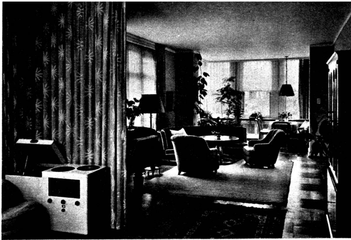
un salon de musique et le coin de véranda.

Groupe de sièges très confortables du salon de musique, canapé arrondi, tissu tête de nègre, fauteuils capitonnés tissu vert amande.